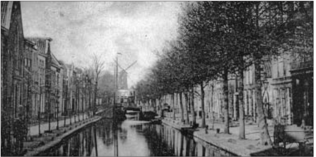
Overzichtsfoto van de Turfmarkt met uiterst rechts de woning van W.F. Büchner.

vinden van een geschikt gebouw om de choleralijders te verplegen. Uiteindelijk werd de Kazerne aan de Varkenmarkt tot hospitaal bestempeld. Zoals viel te verwachten, tekenden diverse omwonenden protest aan. Omdat een alternatief ontbrak, legden de stadsbestuurders hun bezwaren terzijde.