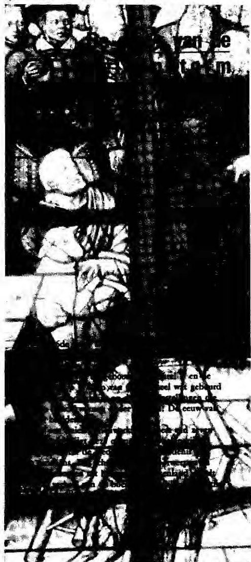
Deze folder ligt gratis voor u klaar, in ons pandje aan de Dubbele Buurt 4.

Hier ligt een kleurenfolder met alle informatie over de zeven tentoonstellingen voor u klaar.