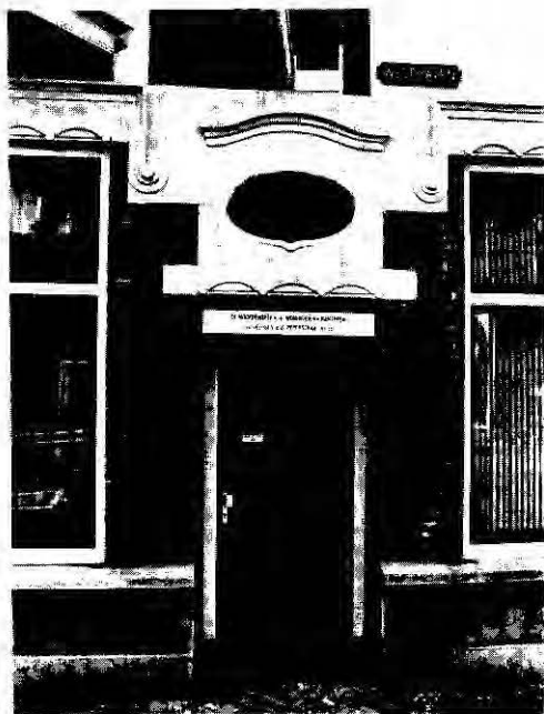
Op deze plek aan de Westhaven herinnert een inmiddels dichtgemaakte doorgang tussen twee gebouwen aan de aanwezigheid van het Stinksteegje. Daar hadden in vroeger tijden dingen plaats, die het daglicht niet konden velen...