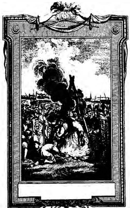
Sodomie-plegers werden soms veroordeeld tot blakeren boven een vuur. Die straf werd ook in Holland toegepast, zoals op de oude gravure te zien is.

In 1778 werden nog eens vijf Gouvenaars uit Gouda verbannen; vervolgens had in 1802 waarschijnlijk de laatste verbanning van een pleger van sodomie plaats. Hun op schrift gestelde verhoren, die in het Goudse gemeentearchief worden bewaard, zijn ook voor de moderne geschiedkundig geïnteresseerde gruwelijk in hun gedetailleerdheid. (Noot 4).