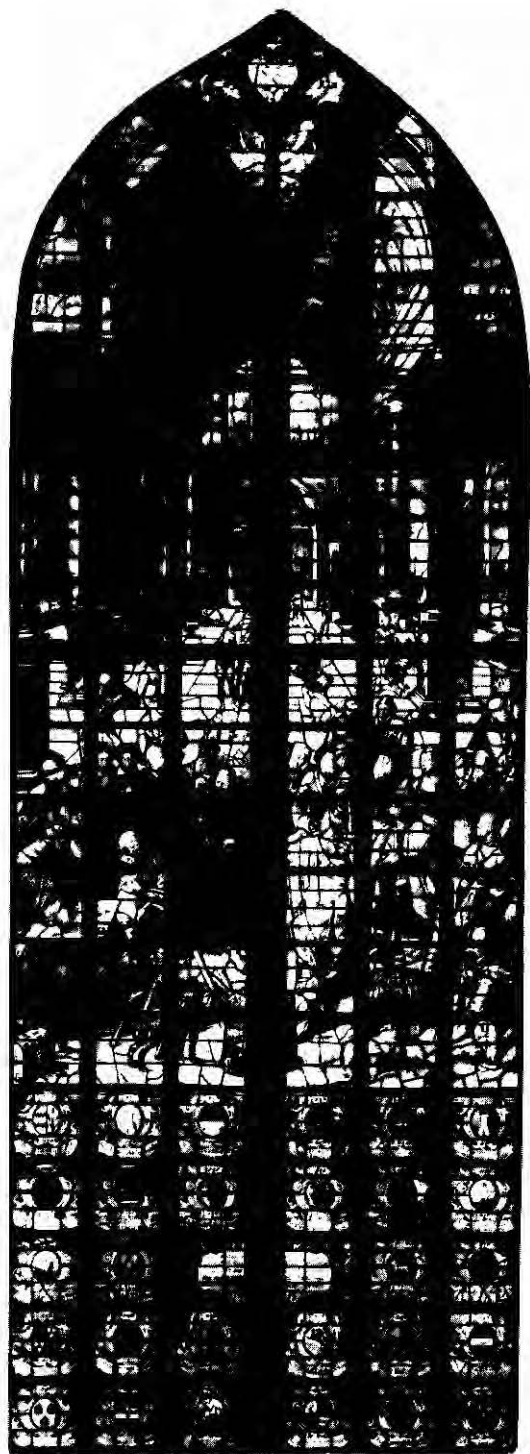
Glas 22 uit de St.-Jan te Gouda.

De tekening werd daarna overgebracht op ware grootte, dus op het formaat van het glas. Zo'n tekening heet een "carton". Deze cartons zijn van alle belangrijke glazen in de St.-Jan bewaard gebleven, evenals het vidimus dat Willem van Oranje heeft gezien. Op genoemde tentoonstelling zal dus naast een gedeelte van het Glas de originele ontwerp-tekening te zien zijn en ook het vidimus, dat als enige in het bezit van de kerkvoogdij is gebleven. Ook een ontwerpschets waarop Willem van Oranje met zijn gemalin Anna van Saksen staat afgebeeld is hier tentoongesteld. Deze schets was bedoeld om de schenker samen met zijn echtgenote in het Glas af te beelden, zoals gebruikelijk was. Dit is echter in Glas 22 nooit het geval geweest. Politieke en/of persoonlijke omstandigheden in het leven van de Prins in die periode zijn hiervan hoogstwaarschijnlijk de oorzaak geweest. De schets is in het bezit van het Historisch Museum te Amsterdam.