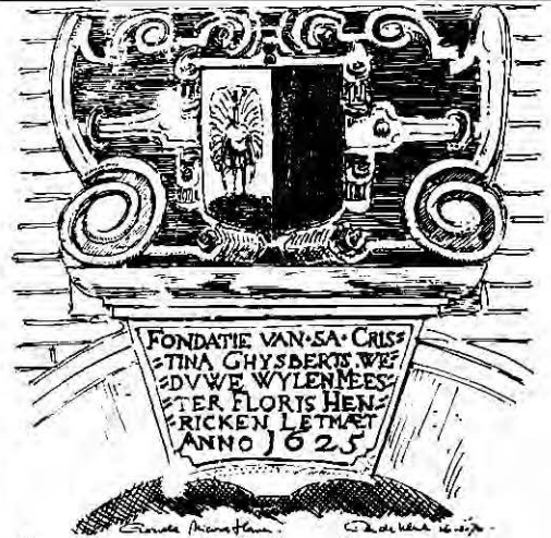
De gevelsteen van het Hofje van Letmaet (tekening: Ger de Klerk).

Op folio 24 staat een pronkende pauw op een zilver veld afgebeeld als het wapen van genoemde Gijsbert Harmensz. De rechter helft (heraldisch