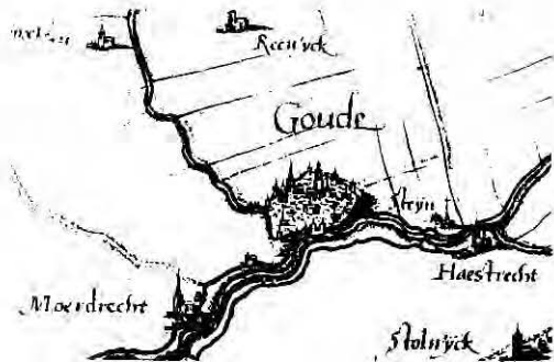
Fragment plattegrond Gouda-Steyn-Haastrecht.