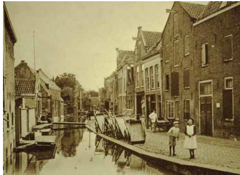
Naaierstraat rond 1900