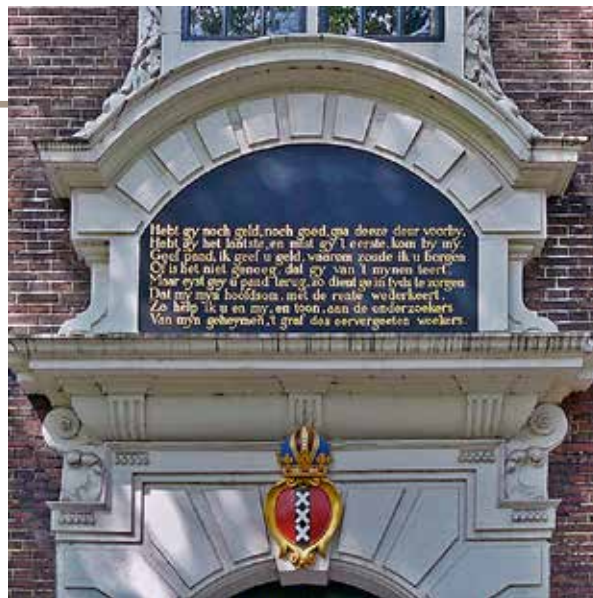
Opschrift Bank van lening Amsterdam

In de middeleeuwen verschenen in veel steden wisselkantoren, later in de volksmond 'lommerd' of 'ome Jan' genoemd. Deze banken waren een uitkomst voor wie even krap bij kas zat, maar handelden niet altijd even netjes. Daarom nam in Gouda het stadsbestuur in 1654 de rol van lommerd op zich. De gang van zaken bij de lommerd was als volgt: tegen afgifte van een onderpand zoals kleding, huisraad, sieraden of boeken, ontving men een bepaald bedrag in contanten. Als bewijs diende een 'lommerdbriefje', waarop het beleende voorwerp, kredietbedrag en verschuldigde rente stonden genoteerd. Hiermee kon het pand binnen een vastgestelde tijd worden ingelost, mits het voorgeschoten bedrag en de rente waren voldaan. De vestiging van ongure pandjeshuizen vormde een probleem. Zij rekenden woekerprijzen, waardoor een deel van de toch al minderbedeelde bevolking in nog grotere problemen geraakte.