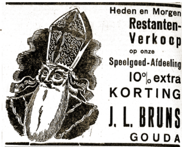
Goudsche Courant 4-12-1939