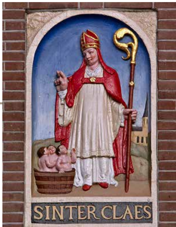
Gevelsteen met Sint-Nicolaas en de drie jongetjes in een pekelvat, hoek Dam/Damrak Amsterdam. Zie voor het verhaal www.catharijneconvent.nl/verhalen/sinterklaas/

De lommerd was als bank van lening een uitkomst in tijden van geldnood. Verdwenen is hij nog niet, maar het aantal banken is behoorlijk afgenomen. Henny van Dolder heeft zich uitgebreid verdiept in het ontstaan van de Goudse lommerd die onderdak heeft gehad in de Agnietenkapel.