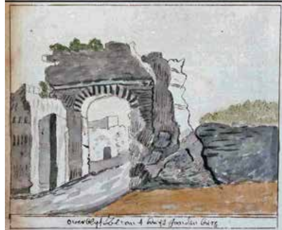
Ruïne van het slot Zandenburg bij Veere, waar Reynier Snoy zijn Paraphrases schreef. Op deze plek schreef Snoy in 1533 zijn Paraphrases . (Collectie Geheugen van Nederland. KB Den Haag)