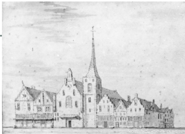
Het Catharina Gasthuis en de Gasthuiskapel met toren in 1585 (gewassen pentekening door Jacobus Stellingwerf, 18de eeuw, SAMH)

In de 16e en 17e eeuw vluchtten tienduizenden om hun geloof vervolgdde protestanten vanuit de Zuidelijke Nederlanden en Frankrijk naar noordelijke streken, waaronder Nederland. Met hun doorgaans orthodox gereformeerde geloofsopvatting en onderwerping aan het gezag van de Bijbel, voelden zij zich nauw verbonden met de calvinistische stroming die de Nederlandse Hervormde Kerk – toen Nederduitsch Gereformeerde Kerk genoemd – vormde. Omstreeks 1622 telde men in Gouda ongeveer vijfduizend Zuid-Nederlandse vluchtelingen. De meesten waren Nederlandssprekende Vlamingen, maar er waren ook veel Franssprekende vluchtelingen onder hen. Daarom nam het stadsbestuur in 1624 het initiatief tot de oprichting van een Waalse gemeente, zodat zij de preek in de eigen taal konden horen. Als plaats van samenkomst kregen zij de Gasthuiskapel aan de Oosthaven (nr. 9) toegewezen. De Waalse kerk maakte bijna twee eeuwen lang deel uit van het protestantse kerkelijk leven in de stad. In de loop van de 18e en begin 19e eeuw voltrok zich een geleidelijke daling van het aan-