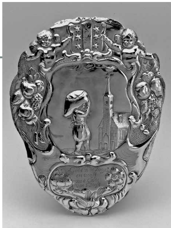
Knapenschild van het zakkendragersgilde