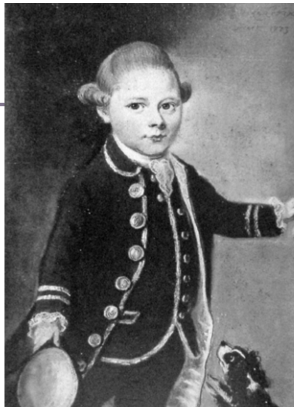
Portret van de zesjarige A.C.W. Staring, 1773, olieverf op doek door Pieter Frederik de la Croix ( https://nl.wikipedia.org/wiki/Anthony_Christiaan_Winand_Staring )