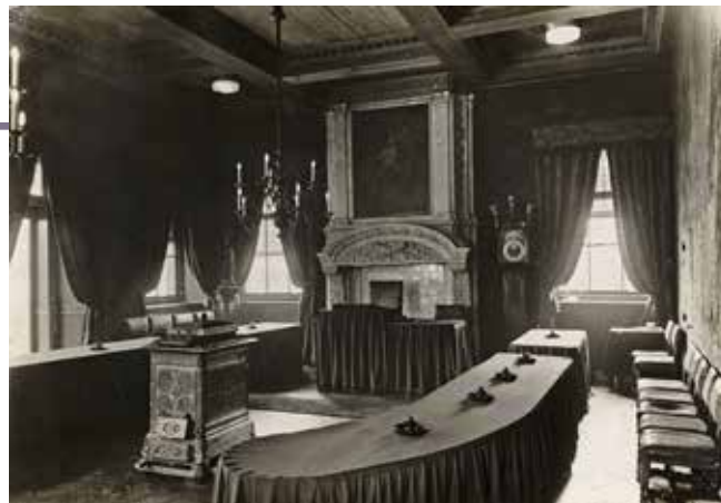
De raadzaal (later de trouwzaal) in het oude stadhuis in 1921

De afgelopen honderd jaar hebben 44 verschillende partijen deelgenomen aan de gemeenteraadsverkiezingen in Gouda. 1 Sommige partijen deden slechts één keer mee, andere bleven (veel) langer bestaan. Soms waren