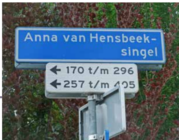
Straatnaambordje Anna van Hensbeeksingel

Geert Post heeft een verslag gemaakt van zijn onderzoek naar een pand aan de Hoge Gouwe onder de titel 'Een verloren gevel aan de Hoge Gouwe'. Ook al bestaat dit pand niet meer, deze cultuurhistorische beschrijving geeft een goed beeld van het aanzicht van de gevelrij aan de Hoge Gouwe. Jammer genoeg is het pand in 1883 gesloopt. Sinds begin maart van dit jaar loopt in het streekarchief de cursus 'Wonen in een historisch pand', ontwikkeld door het Streekarchief Midden-Holland in