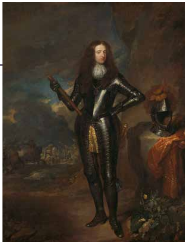
Stadhouder Willem III was niet aan de Waterlinie toen Luxembourg zijn aanval inzette. Caspar Netscher, Portret van Willem III (ca. 1680). Rijksmuseum Amsterdam

In dit artikel staat de komst van duizenden militairen centraal. Om deze troepenopbouw te verklaren zetten we eerst een stap terug naar het Twaalfjarig Bestand (1609-1621). Er werd destijds een groots plan gemaakt