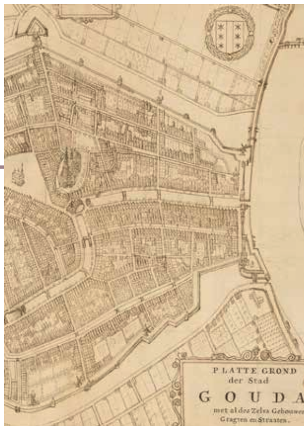
Kaart van Gouda (Rijksmuseum Amsterdam RP-T-AO-10-52,6)