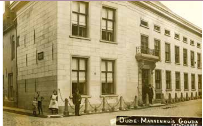
Het Willem Vroesenhuis rond 1920

Het huis werd bestuurd door vier regenten die vaak ook elders in de stad voorname posities bekleedden. Later, ongeveer halverwege de zeventiende eeuw, kwamen er regentessen bij. Het oudemännerhuis werd dagelijks