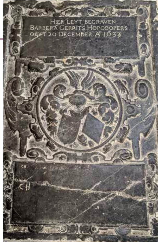
Grafsteen van Barbara Hopcooper

De Hopcoopers vormden een geslacht waarvan de leden in de 16e eeuw tot de hogere lagen van de Goudse burgerij behoorden en nogal eens bestuurlijke functies