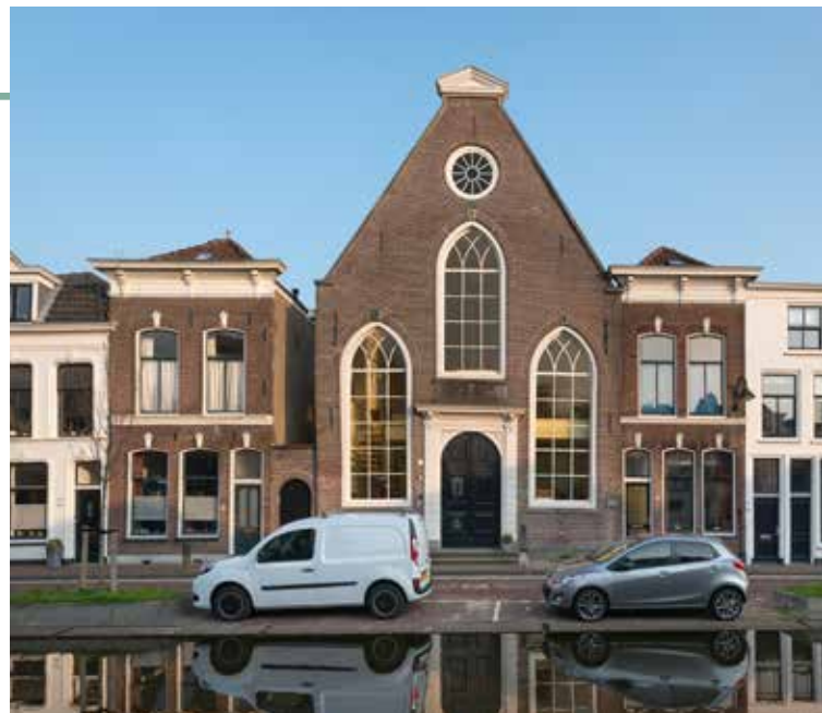
De vroegere joodse synagoge aan de Turfmarkt, nu de kerk van de Vrije Evangelische Gemeente

Begin achttiende eeuw was er een toename in de migratie van arme joden uit Midden- en Oost-Europa naar de Nederlanden op zoek naar een beter bestaan. Het waren over het algemeen arme handels- en ambachtslieden, die Jiddisch spraken, een mengelmoes van Duits en Hebreeuws. Zij stichtten hun eigen synagogen en scholen. Vanaf 1800 maakte de Bataafse Republiek een begin met nationale wetgeving, waarin gestreefd werd naar algemeen geldende normen en regels. Ook op onderwijsgebied kwamen wetten voor het lager onderwijs tot stand en werd een inspectie op dat onderwijs in het leven geroepen. Dit type onderwijs was bestemd voor de armen, het 'gewone' volk, was betaalbaar en paste bij het beroepsniveau van het onderwijzend personeel. Kinderen van rijke ouders gingen naar een kostschool of kregen huisonderwijs en de allerarmsten moesten werken. Het