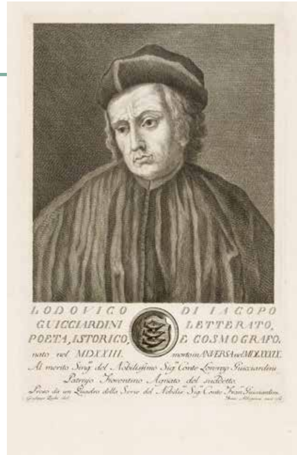
Portret van Luigi (Lodovico) Guicciardini, door Francesco Allegrini, naar Giuseppe Zocchi, uit 1763

Deze beweringen zijn niet noodzakelijkerwijs correct, maar ze zijn wel van belang omdat ze gedaan worden in een tekst die we mogen beschouwen als het vroegste officiële zelfportret van Gouda. Het gaat om een kort stuk, maar het behoort tot een groepje beschrijvingen die met elkaar samenhangen en die elkaar hebben beïnvloed. Ze zijn gepubliceerd in de Nederlandse en de Latijnse editie van de beroemde Beschrijving van de Nederlanden door de Italiaan Lodovico Guicciardini. Die verscheen voor het