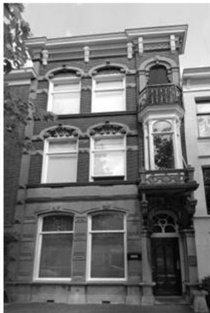
Lage Gouwe 166

Gouda telt ruim 70.000 inwoners. Ongeveer 15.000 daarvan zijn migranten, waaronder ruim 6.000 van Marokkaanse afkomst. De eerste Marokkanen kwamen in 1965 aan op het station van Gouda. Hun eerste gang was naar het arbeidsbureau. Daarna gingen zij aan het werk bij bedrijven als Compaxo, de Kaarsenfabriek en de Garensponnerij. Ze woonden vaak onder erbarmelijke omstandigheden in pensions. Toen in de jaren '70 de gezinshereniging op gang kwam, huurden of kochten Marokkanen vaak een woning in de saneringswijken. De eerste moskee werd in 1976 geopend. Het station, Compaxo, moskeeën... allemaal locaties die van betekenis zijn (geweest) voor Marokkaanse Gouwenaars. Op initiatief van Stichting Boughaz is een wandeling langs deze en vele andere gebouwen samengesteld. De stichting wil de belangstelling voor de geschiedenis van de Marokkanen in de regio Gouda bevorderen.