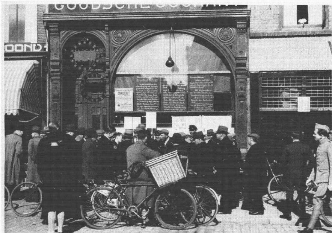
• Verkiezingsdrukte aan de Markt voor het oude Goudsche Courant-pand.