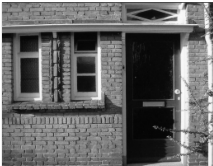
Detailopname van een met sloop bedreigde woning aan de De Lange van Wijngaerdenstraat.

terie van Wederopbouw en Volkshuisvesting.