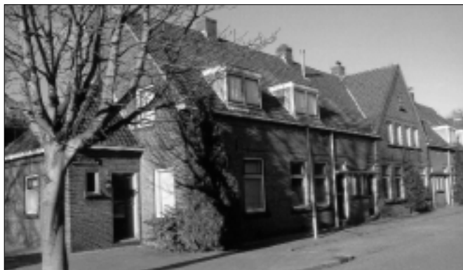
De met sloop bedreigde woningen De Lange van Wijngaerdenstraat 2 t/m 12 in 2004.