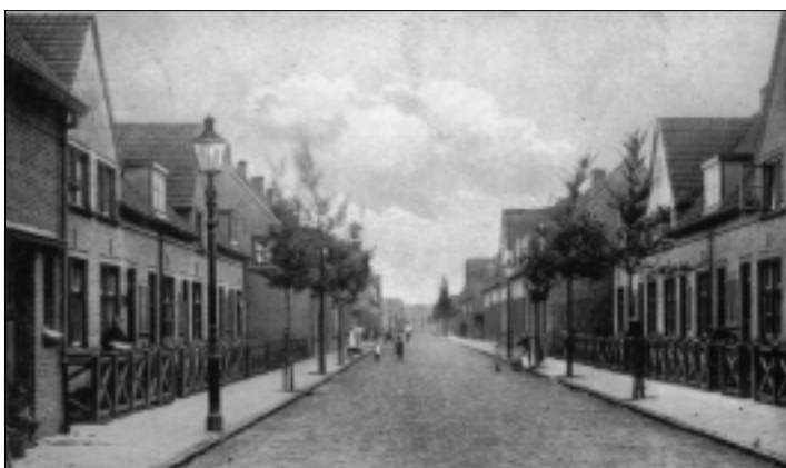
Sint Josephstraat, circa 1925.

Kenmerkend voor een tuindorp zijn de voorzieningen. Zo kende de Josephbuurt twee winkel/woonhuizen op de hoek Zoutmanplein 2/Zoutmanplein 19. Op de begane grond bevonden zich de winkels met daarboven een woonverdieping. Thans worden ook de winkels bewoond. Het blokje is rijker versierd dan de omliggende woningen. De geveltop bijvoorbeeld is in gele baksteen uitgevoerd.