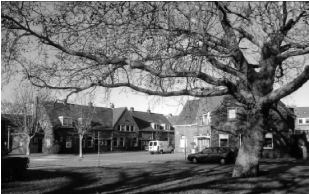
Zoutmanplein in 2004 met links op de achtergrond de met sloop bedreigde woningen De Lange van Wijngaardenstraat 2 t/m 12.