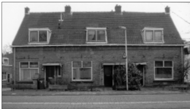
De met sloop bedreigde woningen Karnemelksloot 56 t/m 60 in 2004.