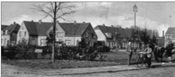
Zoutmanplein, circa 1925.

Gouwe. Het 63 woningen tellende wijkje strekt zich uit van de Ferdinand Huyckstraat tot de Kanaalstraat. De Parkweg, voorzien van een breed middengedeelte, vormt hiertussen de verbinding. Bij de renovatie in 1985 werden de bakstenen gevels voorzien van een crèmekleurige isolatielaag met als gevolg dat de detailleringen verdwenen. Het voornemen bestaat om binnen afzienbare tijd deze woningen, die veel van vocht hebben te lijden, te slopen. Een meer uitgesproken tuindorp is de Josephbuurt.