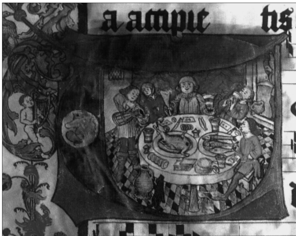
Middeleeuwse maaltijd, waarbij vis, wild, brood en bier de voornaamste bestanddelen vormden. Miniatuur uit een handschrift van Johan van Deventer (1512).

Met dit gegeven moeten de cijfers die in de impostregisters staan dus betrekking hebben op de eigen produktie (en consumptie) van de kloosters. Ze zijn daarmee bruikbaar als een indicatie voor de relatieve grootte van de diverse kloosters. Bij gebrek aan gegevens over het aantal conventualen in de Goudse kloosters, is dat een zeer welkome aanvulling. Een kleine vertekening kan optreden door de proveniers verblijvend in de geestelijke instellingen: de wereldlijke kostgangers. In 1544 werd door het Hof van Holland een vonnis van het Goudse gerecht bevestigd, waarbij bepaald was dat de regenten van het St. Elisabeth gasthuis bieraccijns dienden te betalen voor de proveniers aldaar. 12