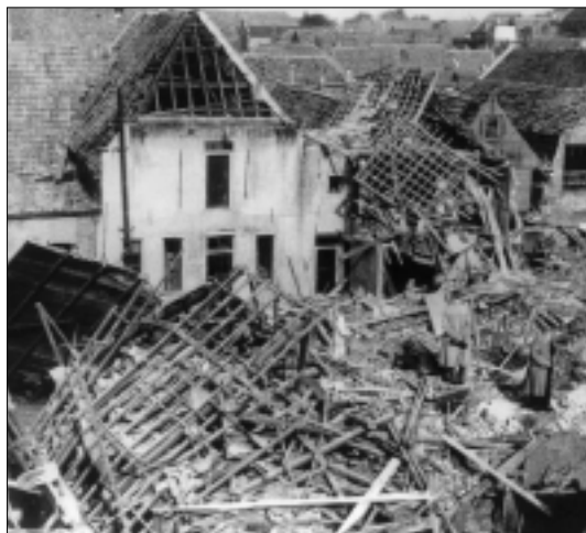
Door een bombardement beschadigde huizen aan de Nobelstraat, 18 september 1944.

van onderwerpen die met de ondergrondse katholieke geloofsbeleving samenhangen zoals het optreden van de plaatselijke overheid tegenover de verboden kerkelijke organisatie, de kunst in de schuilkerken, klopjes (ongehuwde vrouwen die een onmiskenbaar aandeel hadden in de organisatie van de parochies) en de strijd tussen de reguliere en de seculiere pastoors.