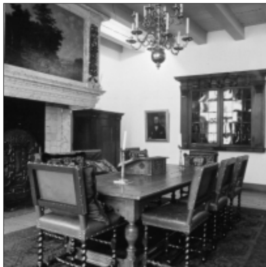
Chirurgijnskamer in museum 'Het Catharina Gasthuis'.