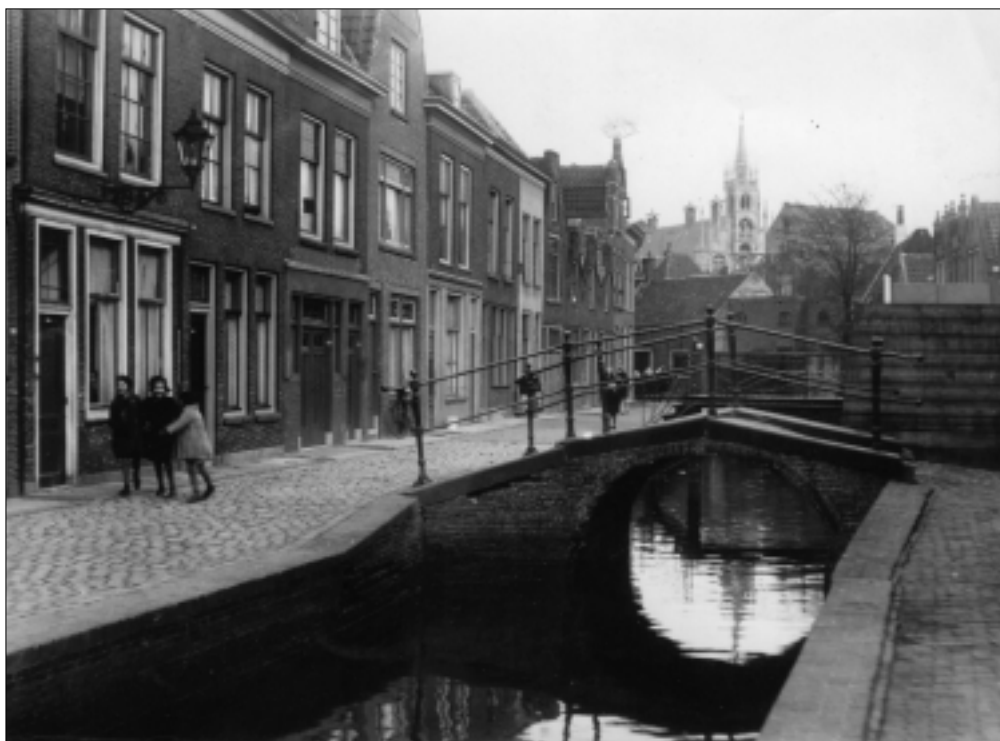
Achter de Vismarkt vóór de demping.