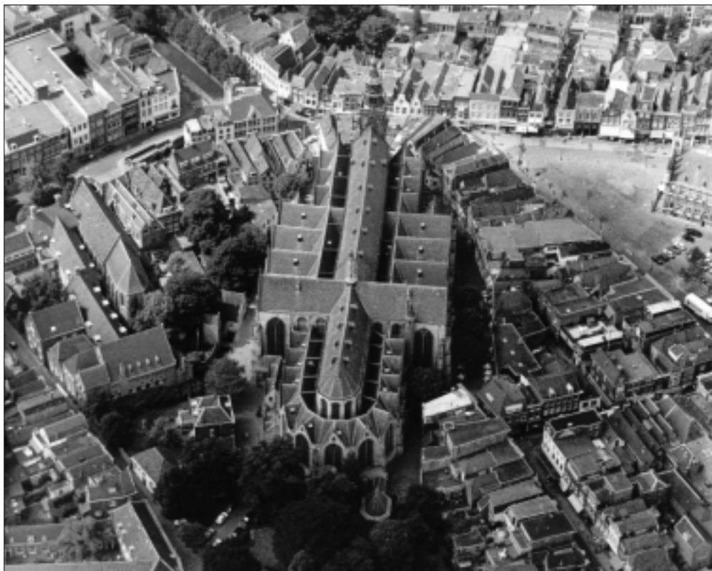
Sint-Janskerk en omgeving.