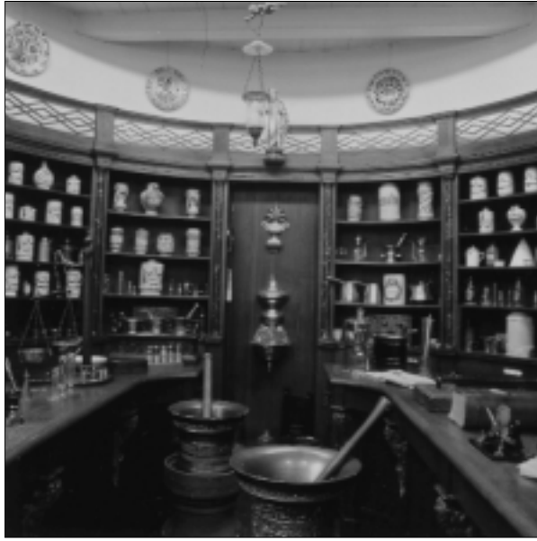
Apotheek in museum 'Het Catharina Gasthuis'.

richten naar de Goudse farmacie, uitmondend in een dissertatie, getiteld De ontwikkeling van de artseneijbereidkunde in Gouda tot 1865 , die verscheen als negende uitgave in de reeks Bijdragen . In tegenstelling tot het proefschrift van Bik, dat een verhalende geschiedenis bevat, met als bijlage een aantal (fragmenten van) bronnen, is de studie van Grendel vrijwel uitsluitend een bronnenpublicatie. De archivalia zijn voor een belangrijk deel in extenso opgenomen met aan het begin van elk hoofdstuk een korte inleiding en hier en daar onderbroken door een summiere toelichting.