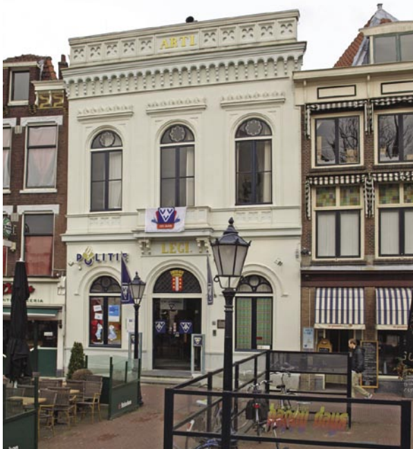
Gebouw Arti Legi, waar in 1860 het Kantongerecht was gevestigd. Pal voor dit gebouw werd de executie voltrokken.

Op de Markt had zich in de loop van de ochtend een enorme verzameld. De officier van justitie, die over de terechtstelling rapporteerde, schatte het aantal mensen op zes à zeventuizend. 20 Hoewel de grootte van zo'n mensenmassa vaak moeilijk is te bepalen, ging het hier toch om een aanzienlijke hoeveelheid mensen. Dat blijkt ook uit verschillende krantenverslagen. De NRC noemde de publieke belangstelling 'verbazend groot'. 21 De Rotterdamse Courant sprak van een 'ontzettende menigte'. 22 Volgens de Nieuwe Rotterdamsche Courant (NRC) en het Dagblad van 's Gravenhage waren vooral veel mensen van het platteland op de executie afgekomen. Ongetwijfeld zullen daar veel Reeuwijkers bij zijn geweest. Een ooggetuige sprak van duizenden mensen. Een andere zei dat het zwart zag van de mensen, die in een halve cirkel om het schavot stonden. 23 De menigte werd op afstand gehouden door enkele rijksveldwachters, de agenten van gemeentepolitie en het gehele Goudse garnizoen infanterie dat uit ongeveer 250 man bestond.