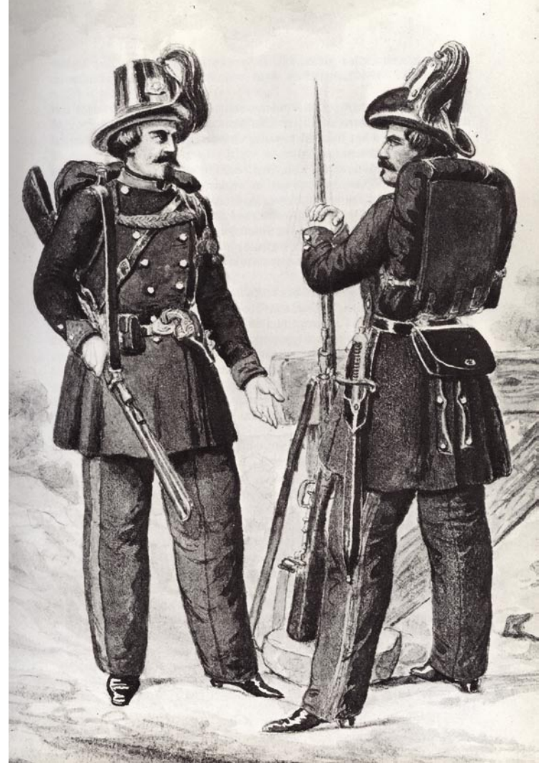
Rijksveldwachters in 1859. Tekening van J.F. Tielens (Nederlands Politieuseum)

Het rechercheonderzoek stond in die dagen nog in de kinderschoenen. Het was goeddeels gebaseerd op verhoor en het sporenonderzoek op louter visuele waarneming. Scherpzinnigheid en vindingrijkheid waren in dit geval onmisbare eigenschappen. Technische hulpmiddelen ontbraken. Er bestond nog geen opleiding voor rechercheur. Er was überhaupt nog geen sprake van specialisatie met betrekking tot de opsporing. Pas in de jaren 1880 en 1890 kreeg de opsporing een eigen plaats binnen de politieorganisatie. Nieuwe methoden en technieken, ontwikkeld in het buitenland, vonden een weg naar de Nederlandse politiekorpsen. Belangrijke vernieuwingen waren de Bertillonage, een systeem waarbij men op grond van lichaamsafmetingen- en verhoudingen de identificatie van misdadigers wilde verbeteren en de dactyloscopie, het systeem waarbij de vingerafdrukken gebruikt werden voor identificatie. Goudse politiemensen werden voor het eerst in 1897 op een cursus dactyloscopie gestuurd. In 1859 waren deze hulpwetenschappen