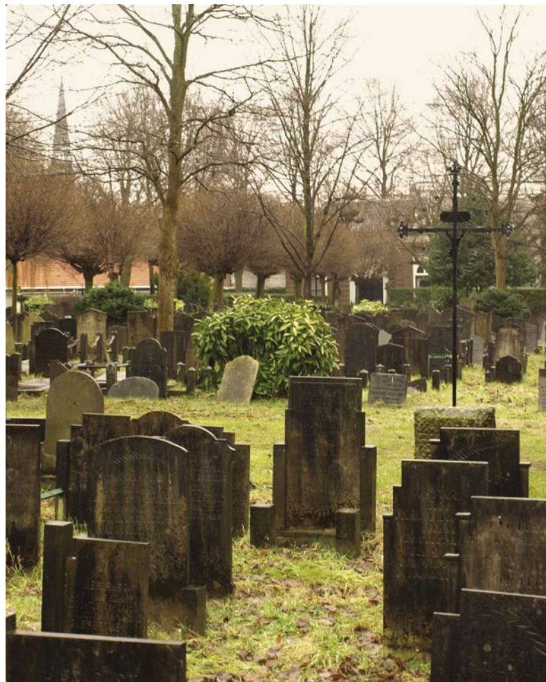
Het katholieke deel van de Algemene Begraafplaats aan de Vorstmanstraat. Hier werd Pieter Pijnacker begraven. Het graf is inmiddels geruimd.

Met dank aan Loet van Vreumingen voor het aanleveren van een deel van de informatie.