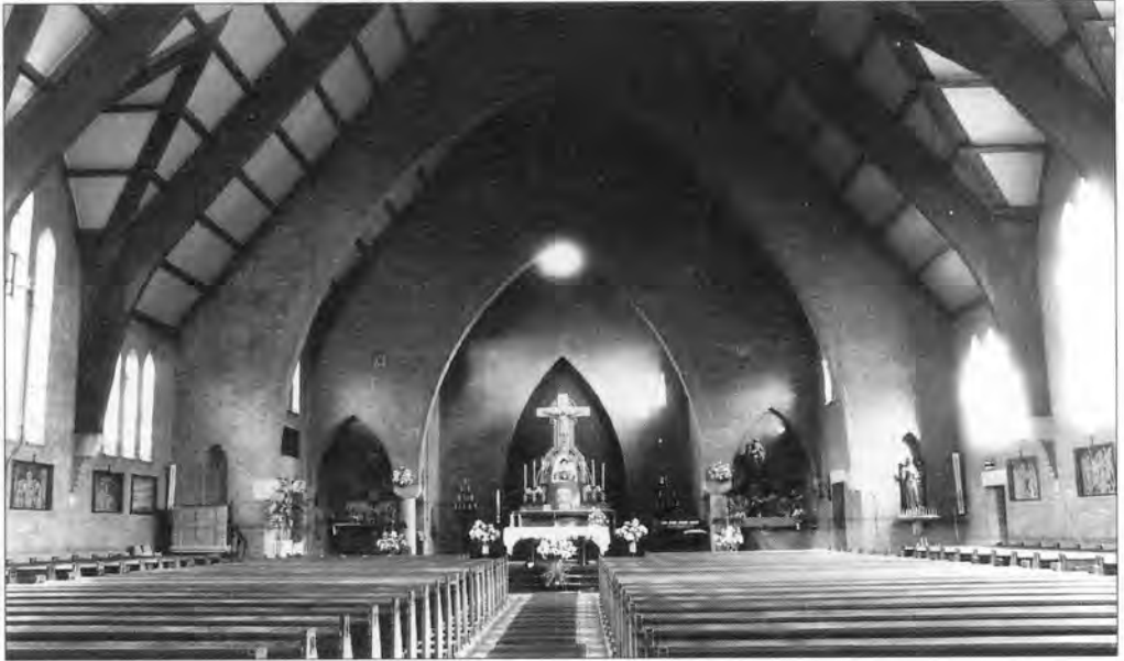
Het interieur gezien naar het altaar.