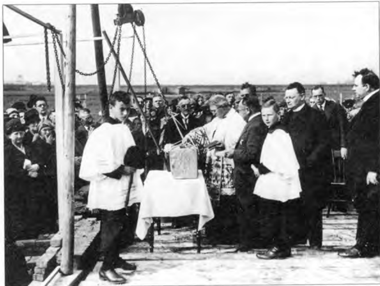
Het leggen van de eerste steen op 9 september 1931.