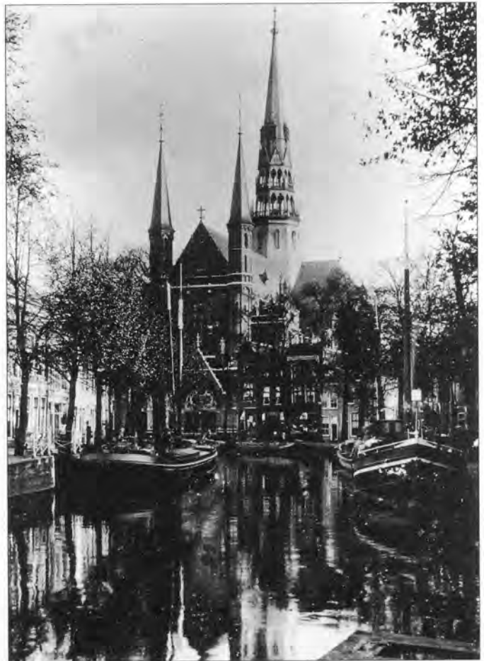
De Sint-Jozefkerk aan de Hoge Gouwe, voltooid in 1903.

De stadsuitbreiding heeft tot gevolg dat het kerkelijk leven zich verplaatst naar de buitenwijken. In Gouda-Noord wordt op 18 juni 1959 een noodkerkje ingewijd, dat de naam van 'Verbondskerk' draagt. Er bestaan dan al plannen voor de bouw van een kerk met zevenhonderd zitplaatsen. Deze nieuwe Sint-Jozefkerk (vanwege haar toren ook wel de Kolenkit genoemd) verrijst aan het Aalberseplein en wordt op 22 december 1963 ingewijd. Het