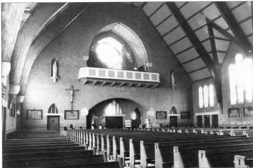
Interieur met orgelgalerij.