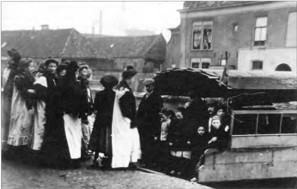
Spitsuur bij het veerpontje dat in 1932 werd vervangen door een nieuw exemplaar.