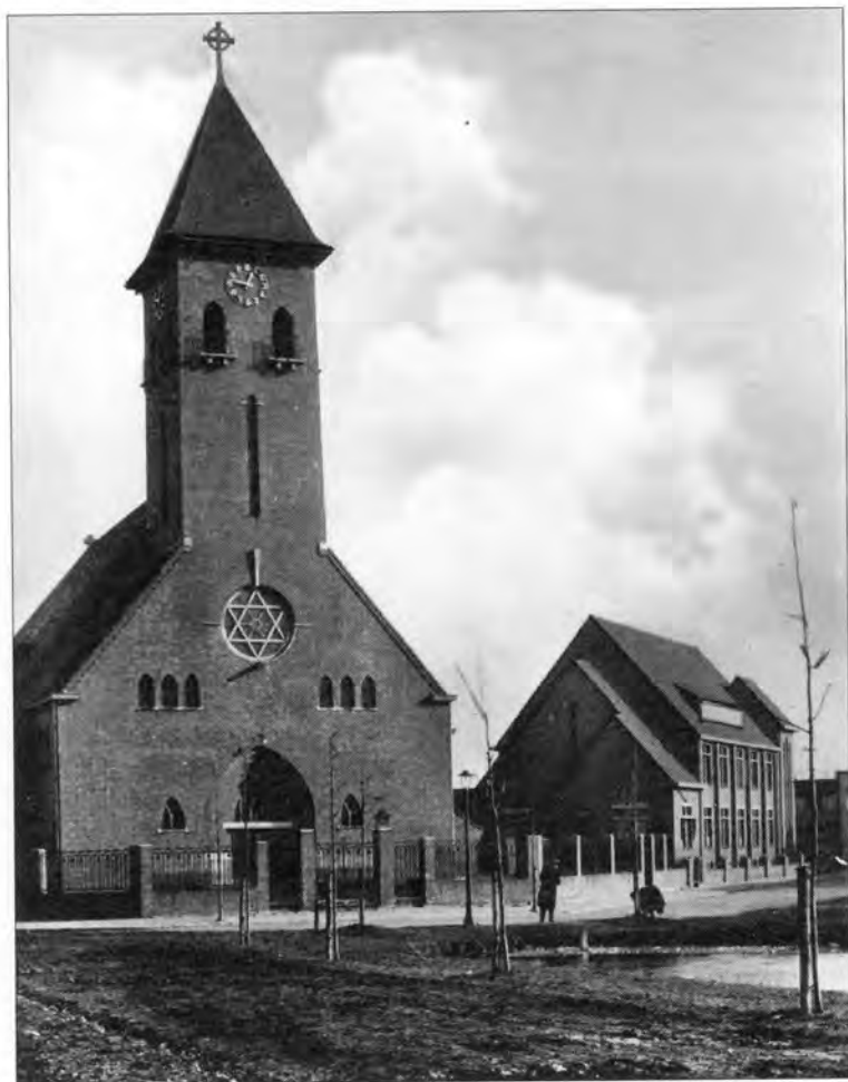
Het exterieur van de kerk en het naastgelegen klooster.

bolische bedrag van één gulden overgenomen en zo krijgt de stad een waardevol geschenk ter gelegenheid van haar 700-jarig bestaan.