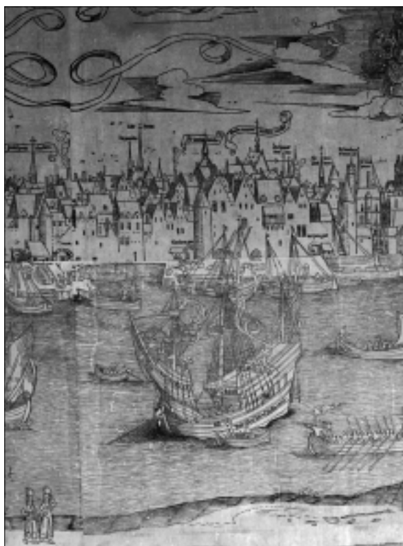
'Dits tship dat van Jherusalem comt'. Houtsnede met panorama Antwerpen, ca. 1515 (detail). Stedelijk Prentenkabinet Antwerpen.

Na Rhodos schijnt de reis probleemloos te zijn verlopen. De drie getuigen geven daar geen bijzonderheden over. Uit de literatuur is bekend dat de 'Salvator' naar Sicilië voer om vervolgens koers te zetten richting Rome. Daar werden enkele pelgrims aan