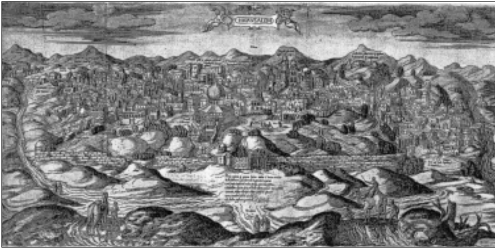
Gezicht op Jeruzalem, 16e eeuw. Gravure door Stefano du Perac. Maritiem Museum Rotterdam, inv.nr. WAE 808.