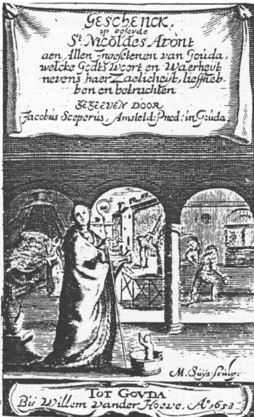
Uit het boek van de Goudse predikant ds. Jacobus Sceperus