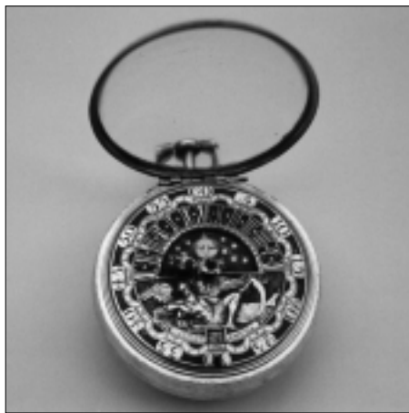
De zilveren wijzerplaat.