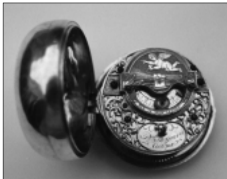
De achterzijde van het uurwerk.

voorzien van de cijfers VI-XII-VI. Het betreft hier een zon- en maanhorloge, ook wel dag- en nachthorloge genoemd. In de periode van 1680-1710 werd dit type horloge niet alleen in Nederland maar ook in Engeland en Duitsland ontwikkeld. Ook in de loop van de achttiende eeuw bleef dit in Nederland nog populair.