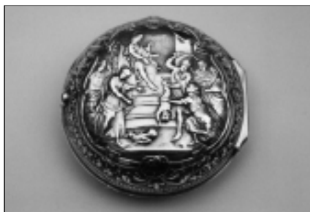
De zilveren buitenkast.