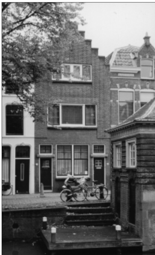
De woning Lage Gouwe 54 (2003).

Van Pieter Thijmen is overigens nog een horloge bekend. Het bevindt zich in het Science Museum in Londen. De omschrijving luidt: 'zakhorloge met zilveren gedreven buitenkast en gladde binnenkast, zilveren kloof met allegorische voorstelling in bas-reliëf, waaronder de inscriptie "de min overwint alles", gemerkt Pieter Thymen a Gouda'. Bijzonder is dat dit horloge in het voorjaar van 1956 in bruikleen is gegeven voor de tentoonstelling over het Nederlandse uurwerk 'Hoe laat was het?' in het Museum Willet Holthuysen te Amsterdam. Ook van Baltus Thijmen is een horloge bekend. Dit bevindt zich in het Nederlands Goud-, Zilver- en Klokkenmuseum in Schoonhoven. De omschrijving daarvan luidt: 'zakhorloge met spillegang, Engelse bouw, in dubbele zilveren kast en met zilveren wijzerplaat, met valse slinger'.