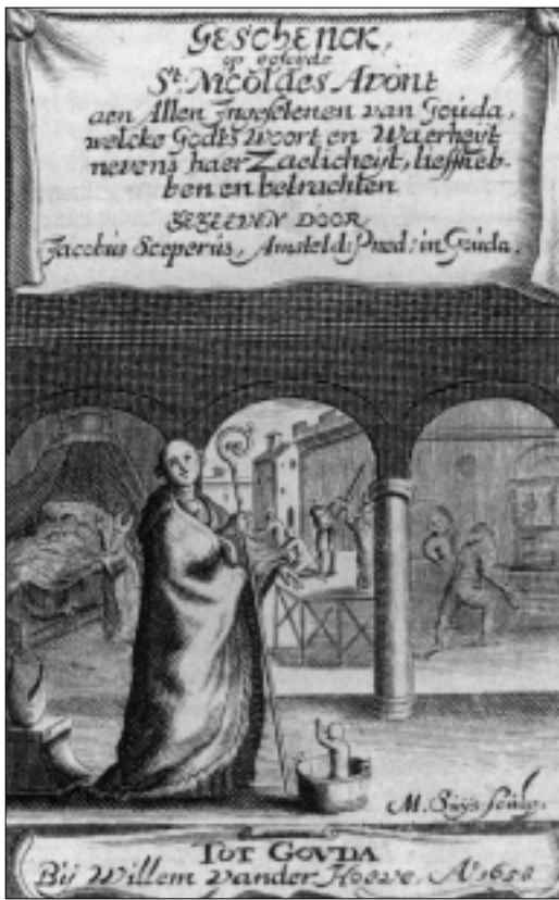
Gravure door M. Suijs, 1658.

een Grietgen Suijs is genoteerd met als doopdatum 27 november 1642 en later een Margrieta Suijs met als doopdatum 7 juni 1652.