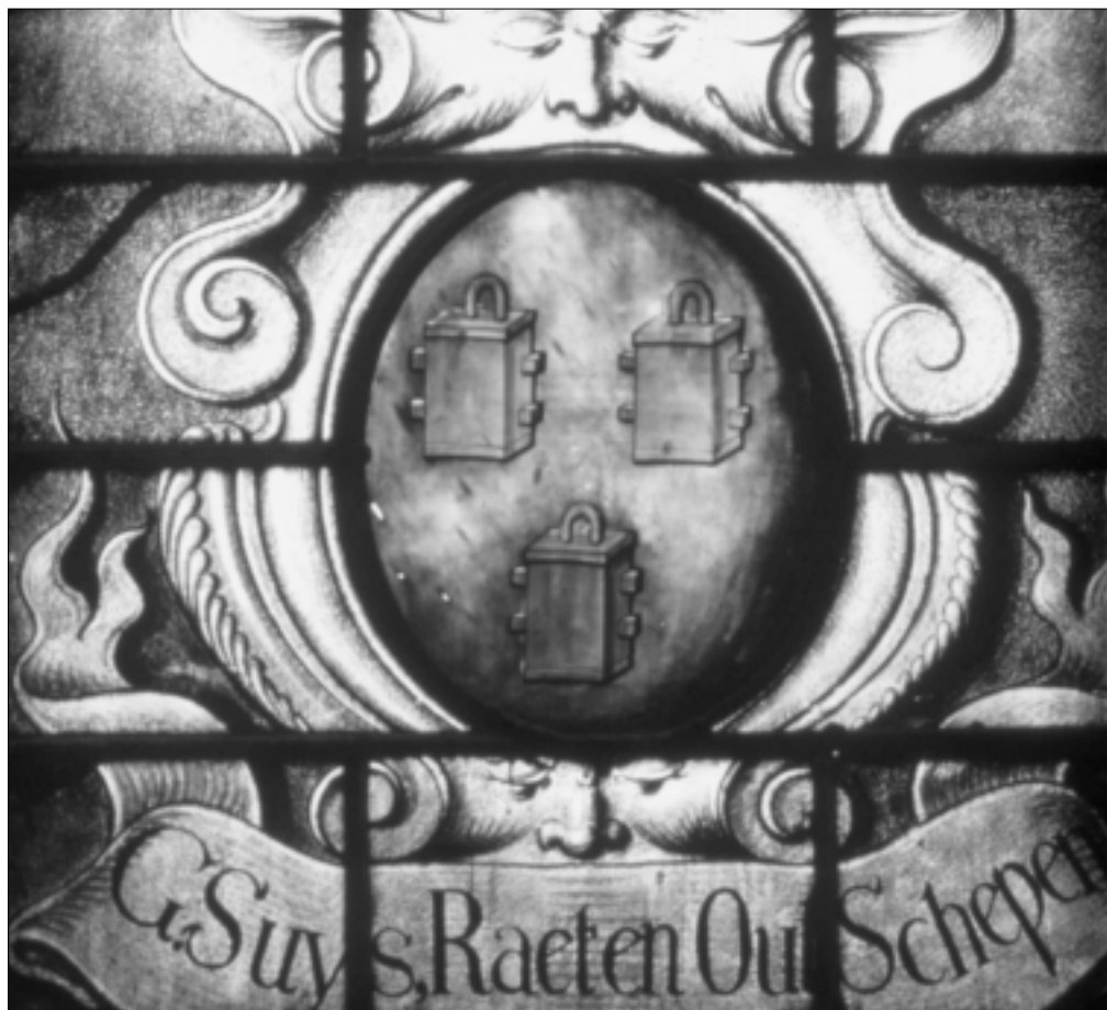
Glas 22. Detailopname van familiewapen Suijs.

de door anderen getekende portretten van zijn opvolgers (in ongeveer dezelfde stijl). Tellen we van linksboven naar rechtsonder, dan komen we tot de ontdekking dat tekening dertien in het boek ontbreekt. Merkwaaardig is dit zeker!