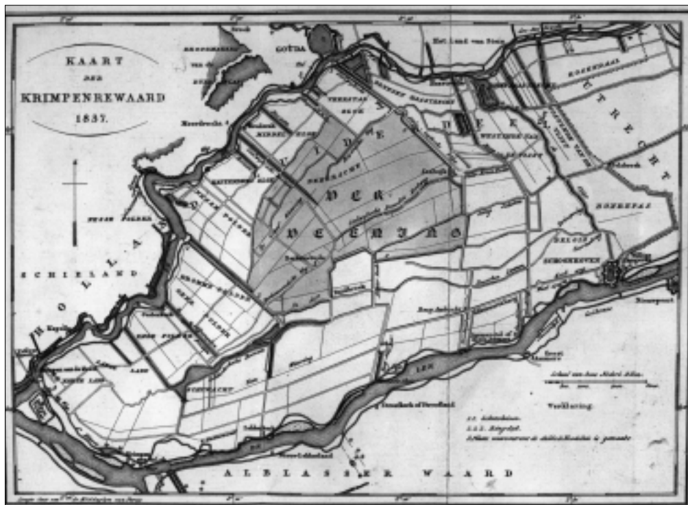
Kaart van de Krimpenerwaard met donker gekleurd het gebied van de geotrooieerde vervening.

Landerijen' het geld zou genereren voor het onderhoud van de dijken. 11 Ook Gouda zou profiteren door de komst van een welvend landbouwgebied voor de deur en door een verbetering van de waterhuishoudkundige situatie.