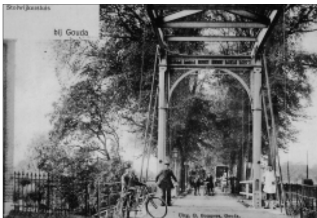
De Stolwijkersluis aan het begin van de twintigste eeuw. Ansichtkaart; met dank aan de heer P. Anker te Stolwijk.

De vrije watergang van Stolwijk naar de Hollandsche IJssel leverde in de buurtschap een bestuurlijk ingewikkeld beeld op. Ter plaatse botsten de ontginningen uit het oosten en die uit het westen op elkaar. 7 De buurtschap hoorde lange tijd tot drie gemeenten: Haastrecht, Gouderak en Stolwijk. Het gebied van Stolwijk was een enclave tussen de beide