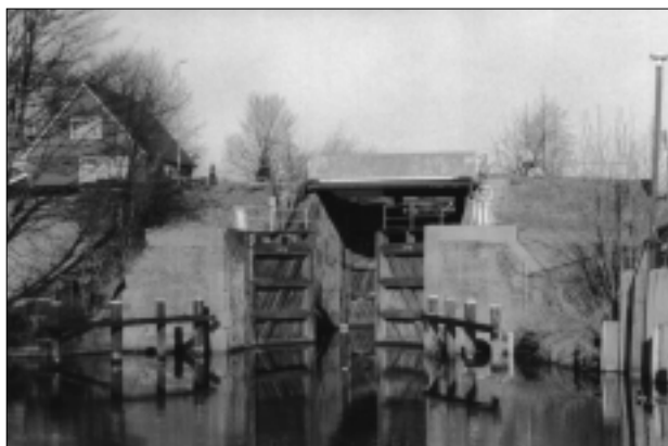
De Stolwijkersluis gezien vanuit het zuiden.

sluis zelf, ook de vliet die er op uitkomt, is een deel van het verhaal. Deze Stolwijkse (of Goudse) vliet is oorspronkelijk gegraven als ringvaart rond de te vervenen en in te polderen gronden. Dit was de 'neksloot', wat 'ringsloot achter de ringdijk' betekent. Later stond zij bekend als de Vaart der Veenderijen. In de omgeving van de sluis treffen we bovendien nog andere elementen aan die iets zeggen over de waterbouwkundige geschiedenis van deze bijzondere plek. Het is dit gezamenlijke ensemble van bedrijfshistorische, waterbouwkundige en landschappelijke aspecten dat tot de verbeelding spreekt.