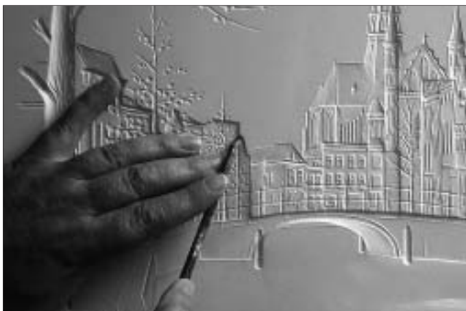
Details aanbrengen in het tegendeel.

Wat mij drijft is dat ik houd van de stad waar ik geboren ben en opgegroeid, en van de vele monumenten uit een rijk verleden, waar de sfeer nog van te proeven is. Ook zelf zie ik maar vaak een deel van de schoonheid van de vele geveltjes en gebouwen in onze stad, haastig als ook ik ben. Echter, als je een stadsbeeld uitsnijdt in het gips, en daarbij wel heel goed moet kijken en daar langdurig mee bezig bent, dan valt op wat een mooie stad Gouda is!