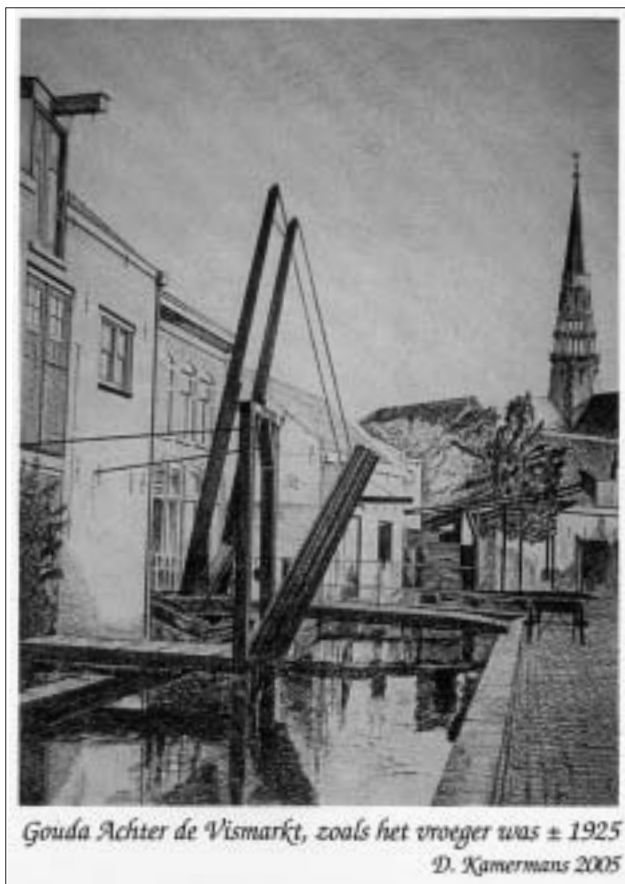
Gouda Achter de Vismarkt, zoals het vroeger was ± 1925 D. Kamermans 2005

Aangezien ik in 1934 te Gouda geboren ben aan het grachtje Achter de Vismarkt, toen nog Achter de Vismarkt, en de gracht tot de demping in 1954 heb meegemaakt in een steeds meer deplorabele staat, was het onderwerp voor mijn kerstkaart 2005 pure nostalgie. Ik heb het beeld dat ik heb getekend, nog altijd voor ogen als ik vanaf de kruising met de Groenendaal de Achter de Vismarkt op wandel. Ook een paar van mijn olieverfschilderijen hebben die gracht als onderwerp. Verder heb ik, als geboren Gouenaar, een warme belangstelling voor Gouda. En dan vooral de historische stad waar ik graag in rondwandelen. Als ik een oude foto van een Gouds stadsgezicht tegenkom, kijk ik altijd met de gedachte in het achterhoofd: 'Is dit geschikt om te tekenen?!