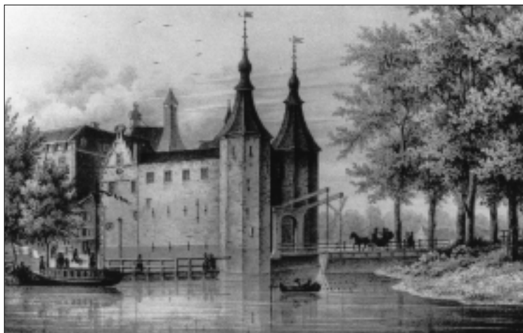
De Tiendewegspoort.

Een belangrijk deel van de straten was verhard en voorzien van straatnaamborden. 's Avonds zorgde een beperkt aantal ouderwetse raapolielantaarns voor een bleke verlichting. De belangrijkste straten hadden hardstenen stoepen langs de gevels van de woningen, veelal voorzien van palen en siersmeedwerk. Een fraai voorbeeld is de in 1831 voor een bedrag van 400 gulden aangelegde stoep van blauwe zerken met kettingen tussen de stoeppalen langs de dat jaar gerenoveer-