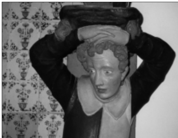
Console met weeshuisjongen, te zien in het voormalige Weeshuis (nu Openbare Bibliotheek) aan de Spieringstraat.

den, zorgden voor de nodige bedrijvigheid. De wachttijd tijdens het schutten werd gebruikt voor het doen van inkopen, terwijl eventuele schade werd hersteld bij een van de scheepswerven. Gouda deed niet alleen dienst als doorvoerhaven, maar was tevens marktplaats. Naast de weekmarkt met een vooral regionale betekenis, kende Gouda een jaarmarkt met luxe producten die door mensen uit alle delen van het land werd bezocht. Deze markt, die eind juli werd gehouden, viel samen met de jaarlijkse kermis.