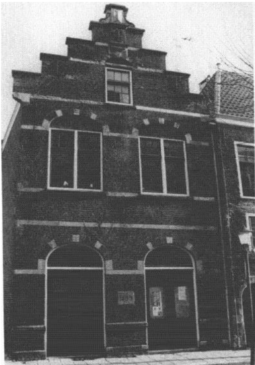
Het hoekpand uit 1899, waarin onder één dak een vrouwenlaapzaal, een badkamer en een mortuarium verenigd waren.

De Werkinrichting veranderde geleidelijk in een bejaardentehuis, waar mannen en vrouwen niet meer verplicht werden te werken. In 1954 werd de naam veranderd in 'Huize Groeneweg'.