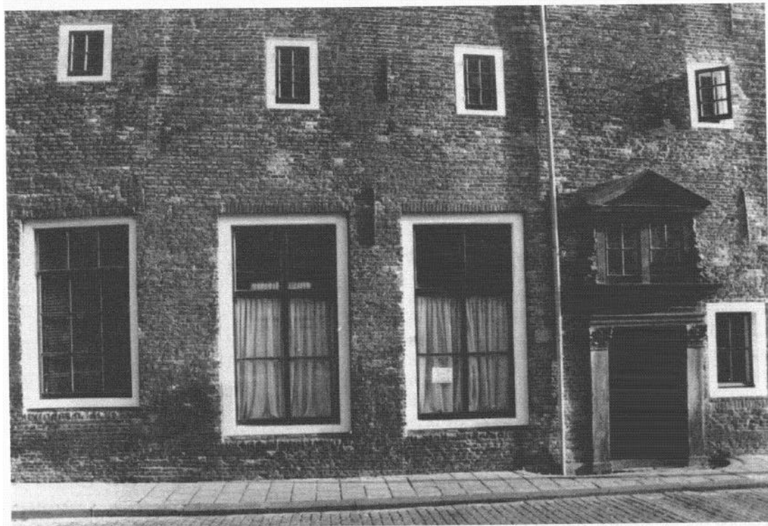
De kleine raampjes op de eerste verdieping van 'Huize Groeneweg' roepen herinneringen op aan de klooster-cellen. Rechts het toegangspoortje van de Latijnse School, met de spreuk van rector Tollius: "Praesidium atque decus, quae sunt et gaudia vitae/Formant hic animos Graeca Latina rudes" ] Foto: Wim Scholten

Op het parkeerterrein tussen Huize Groeneweg en de prof. Casimirschool lag vroeger het Heilige Geesterf, bebouwd met twintig huisjes, acht aan de straatzijde en twaalf binnen op het erf. Zij waren eigendom van het Heilige Geestweeshuis. In een witte gevelsteen boven de ingang was het jaartal 1570 aangebracht. In de achttiende eeuw zijn de meeste woninkjes wegens bouwvalligheid gesloopt, de overblijvende werden in 1801 verkocht. In het begin van de twintigste eeuw droeg deze plaats nog de naam van 'Weeserf',