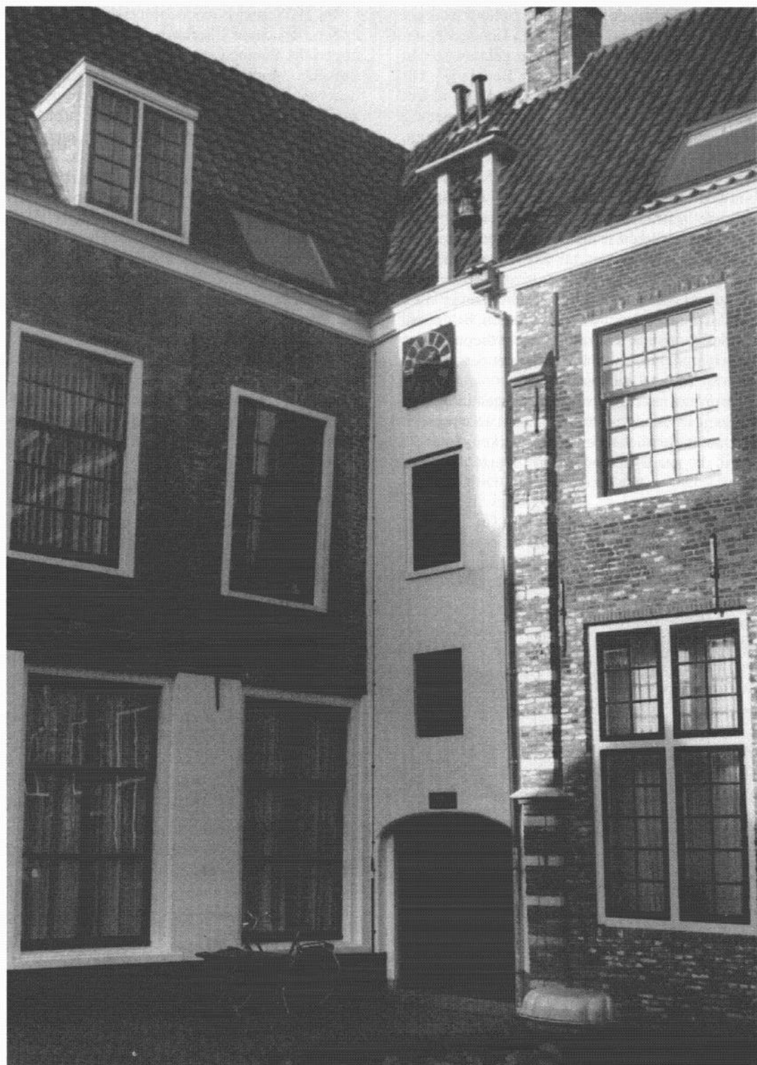
Fraai gerestaureerde gebouwen aan de binnenplaats met vernieuwde klokkenstoel. Op de plaats van de rechtervleugel stond voorheen de kapel van het Cellebroedersklooster.