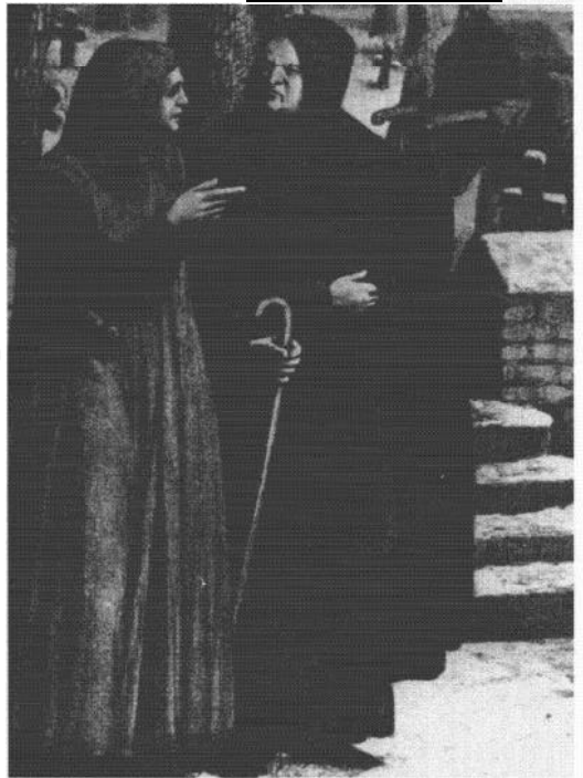
Cellebroeders. Litho van D. van der Kellen uit 'De kloosterorden in Nederland' door W.J. Hofdijk, Haarlem (1865)

Met de stadsbrand van 1438 zijn gegevens over de pest in Gouda van voor die tijd verloren gegaan. Tot aan 1602 was er geen sprake van grote epidemieën. Daar men de oorzaak van de ziekte niet kende bleef het bij het voorschrijven van preventieve maatregelen. Zo blijkt uit een keur van ca. 1490 dat zij, die van de ziekte herstellende waren, maar ook degenen die met besmette personen in contact waren geweest, alleen bij de Collatiebroeders ter kerke mochten gaan "ende nyewers anders". Een andere keur gebood dat de laatsten zouden dragen "in hair hant een witte roede, één vaem lanck (1.82 m) ende niet in 't heijmelijck, mair int openbair".