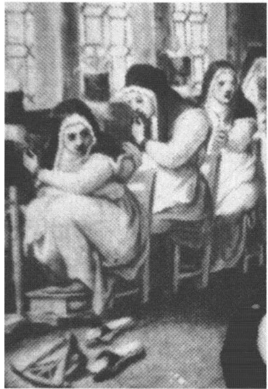
3. Detail uit een zestiende-eeuws schilderij: nonnen in de spinkamer van een klooster.

Een rijk klooster als St. Marie was een wel- come bron van inkomsten voor oorlogvoerende vorsten en pausen ! Toen Karel de Stoute in 1474 de eis stelde dat geestelijke huizen de net- to-opbrengst over drie jaar zouden afdragen van sedert 60 jaar verworven goederen, behoorde St. Marie tot de hoogst aangeslagenen: 205 pond 3 schellingen en 3 penningen. Het Agnie- tenconvent betaalde bij deze gelegenheid slechts 74 schellingen en 6 penningen. In 1534 stonden alle Goudse kloosters, uitgezonderd de bedelorden van Franciscanen en Clarissen, aan de paus de helft van hun jaarinkomen af om de oorlogskosten tegen de Turken te dekken.