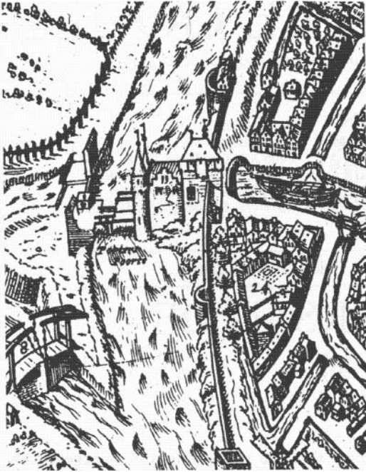
1. Detail uit de plattegrond van G. Braun en F. Hogenberg (1585) Bij nr. 24 het terrein waarop het klooster St. Marie stond. Links daarvan de Potterspoort en bij nr. 8 Rabat.

In de zestiende eeuw gaf het stadsbestuur bevel de muur af te breken, om hier vijftien burgerwoningen te bouwen, hetgeen leidde tot een proces, dat door het klooster werd verloren. Een groot deel van deze huizen werd pas in 1908 afgebroken, om plaats te maken voor de gebouwen van het G.E.B.