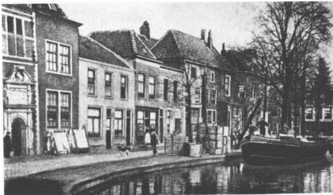
5. Het Nonnenwater, toen nog Rotterdamse Veer geheten. Links het Lazaruspoortje dat nu toegang geeft tot het Stedelijk Museum en de Catharinatuin Achter de Kerk. Het huis op de hoek van het Nonnenwater en de Hoge Gouwe laat in de gevel op de eerste verdieping en het schuine dakprofiel sporen zien van de kloosterkapel.

Gouwe en het Nonnenwater in 1953 werden fundamente van de kapel gevonden, evenals de skeletten van twee vrouwen. Bouwsporen van de kapel, die ongetwijfeld in de huizen aanwezig waren gingen hiermee voorgoed verloren.