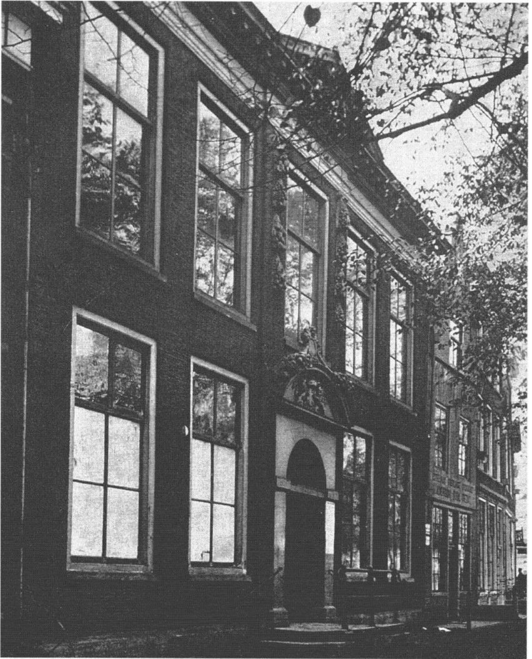
4. Het Proveniershuis aan de Hoge Gouwe, dat in 1909 plaats moest maken voor de bouw van het Gemeentelijk Electriciteitsbedrijf. De beeldhouwde festoenen die het raam boven de deur flankeren zijn nog te zien in de gevel van het Stedelijk Museum 'Het Catharina Gasthuis' aan de tuinzijde.