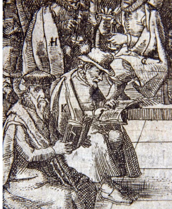
Dirk Volkertsz Coornhert

Hoewel Coornhert op de kar een plek achteraan heeft gekregen, worden in de begeleidende tekst veel woorden gewijd aan deze in 1590 – dus bijna dertig jaar eerder