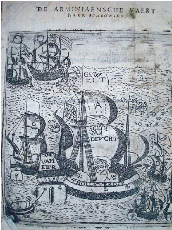
De Arminiaensche Vaert

voor de rooms-katholieken. Ook met deze verwijzing speelt hij weer in op de veronderstelde onbetrouwbaarheid van alle remonstranten en hun geestverwanten.