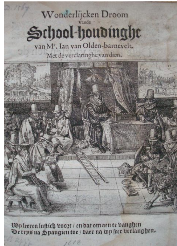
De wonderlijke droom van de School-houdinghe

Onder de letter D in de kar treffen wij een persoon aan die op het moment van vervaardiging van de prent in Gouda woonde en werkte. Het is de theoloog Conradus Vorstius, die de overleden Arminius had moeten opvolgen als hoogleraar theologie in Leiden. Deze benoeming ging op het allerlaatste moment echter niet door omdat met name de contra-remonstranten grote twijfels hadden over zijn rechtzinnigheid. Zij verdachten hem van socinianisme, dat wil zeggen loochening van de goddelijke drie-eenheid, wat gold als zware ketterij. Op expliciete uitnodiging van het Goudse stadsbestuur vestigde Vorstius zich in 1612 in deze stad om van hieruit zijn schriftelijke verdediging te voeren. 7 Hij kreeg niet alleen onderdak en een uitgever voor zijn geschriften in Gouda, maar mocht ook elk avondmaal aanschuiven aan de eerste tafel in de Sint-Janskerk als demonstratieve ondersteuning van Gouda’s onvoorwaardelijke keuze voor de vrijheid van geweten. 8 Voor de pamflettist was dit reden genoeg om in zijn tekst te schamperen dat de Leidenaars Vorstius gelukkig hadden kunnen lozen, maar dat hij nu de eer had om op een Goudse bank te mogen zitten tot