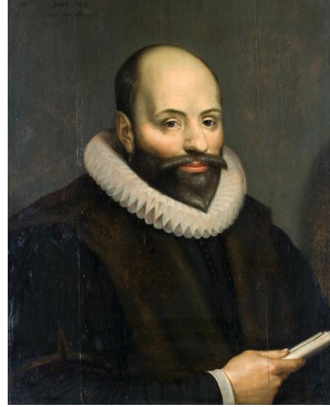
De theoloog Jacobus Arminius

De eigen(zinnige) politieke en kerkelijke koers van het Goudse stadsbestuur kwam meer en meer in het gedrang toen de arminianen het onderspit dreigden te delven. De arrestatie van hun politieke beschermheer Johan van Oldebarnevelt, die werd beschuldigd van hoogverraad, maakte voor prins Maurits de weg vrij voor een militaire machtsgreep. Als opperbevelhebber van de strijdkrachten zette hij zijn soldaten in om de macht en invloed van de individuele Hollandse steden en van de Staten van Holland binnen de bredere Republiek der Zeven Provinciën in te dammen. In een zorgvuldig uitgestippelde campagne trok hij met zijn soldaten alle remonstrantsgezinde steden langs om daar onder dreiging van geweld ‘de wet te verzetten’. Wetverzetten waren politieke zuiveringen van de stadsbesturen, waarbij tegenstanders van de