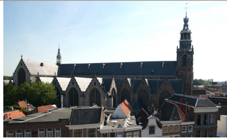
De St. Janskerk gezien vanaf de Markt

Toen deze Staten in 1596 het eerste gebrandschilderde glas voor het verhoogde schip van de Sint-Janskerk aan de stad wilden schenken, was er voor het stadsbestuur dan ook maar één thema dat in aanmerking kon komen: de Vrijheid van het Geweten. Bij het ontwerp voor dit glas greep de Utrechtse kunstenaar Joachim Wttewael