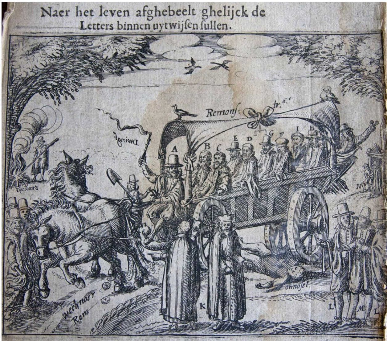
De mestkar met alle hoofdpersonen

Het genoemde Statenglas in de Sint-Janskerk draagt van alle glazen niet toevallig het nummer 1. Zelfs in de nummering van de glazen benadrukte het Goudse stadsbestuur het politieke én kerkelijke belang van dit principe. Het glas illustreert en symboliseert de Goudse