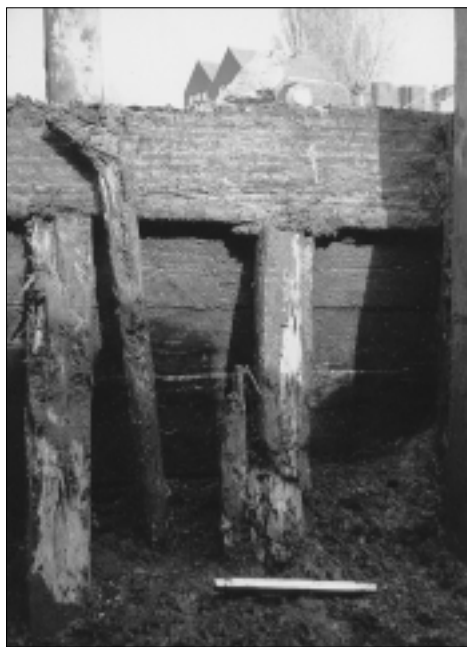
Archeologische vereniging Golda, projectnr. 9413. 17e-eeuwse houten schoeiing van de vestesloot bij de Verlorenkost.

Het college van watermeesters, zuiver gericht op het waterbeheer, was één van de eerste organen dat ingesteld werd ter ondersteuning van de overheidstaak. Bij de instelling in 1488 kregen de watermeesters vrijwel geen volmachten, waardoor het nagenoeg onmogelijk was om orde op zaken te stellen. 8 In 1524 besloot het stadsbestuur wederom tot de instelling van een dergelijk college, omdat de waterschappen te zeer overtimmerd, afgedamd en vervuild waren; toen kregen de watermeesters wel de nodige volmachten. De aandacht en de zorg verslaptten niet, want twee jaar later werd weer de nadruk op de overbouwning van de wateren gelegd en gewezen op de in 1340 wettelijk vastgestelde breedte van de waterschappen, dus dat was ongeveer tweehonderd jaar na die tijd. In 1527 besloot de vroedschap dat de bevoegdheid van dit college van watermeesters uitgebreid moest worden. Ten eerste werd een vijfde meester aangesteld en ten tweede konden de meesters op kosten van de stad, indien noodzakelijk, de hulp inroepen van een timmerman en een metselaar. Het stadsbestuur verwees weer naar 'die oude registeren', 9 met name de veertiende-eeuwse wetgeving. Die oude registeren maakten zoals gezegd nogmaals het uitgangspunt uit van de herziening in 1665 van het waterschapsbeheer binnen de stad. De verwaarlozing van de grachten, die niet op de juiste diepte en wijdte waren gehouden, dwong het bestuur opnieuw om een gewijzigde aanpak van het wateronderhoud te realiseren.