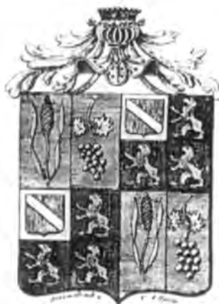
Wapens van Van Swieten (boven) en Moyses Pain et Vin (beneden).