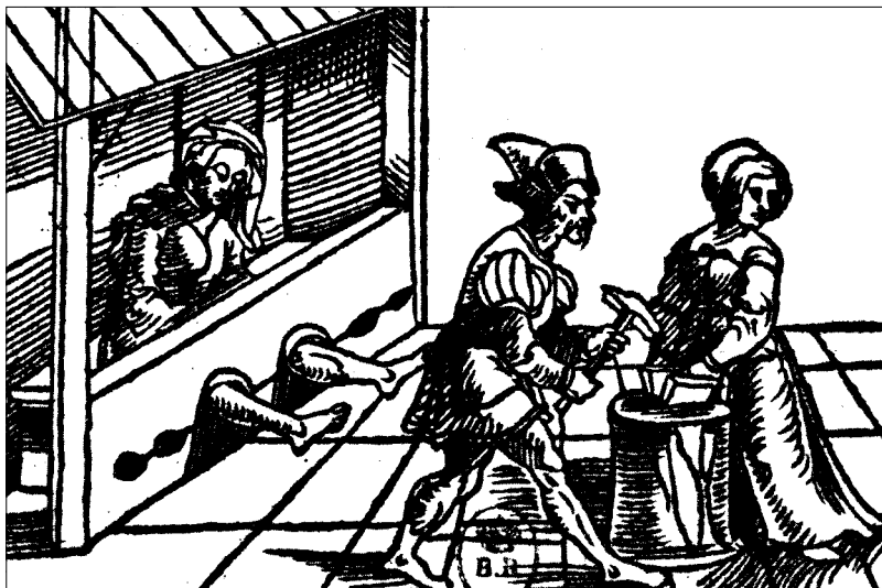
Vrouwen worden gestraft.

van drie jaar uit de stad en vrijheid van Gouda. Een leeftijdgenoot, Michiel Blanckaert uit Antwerpen 14 , werd zwaarder gestraft en samen met twee andere jonge mannen beschuldigd van landloperij, bedelarij en meervoudige diefstal. Zij moesten eerst op het schavot de ophanging van Jochum Melders bijwonen 15 , waarna alle drie op het schavot tot bloedens toe werden geselsd. Na hun geseling volgde een verbanning van 25 jaar. 16