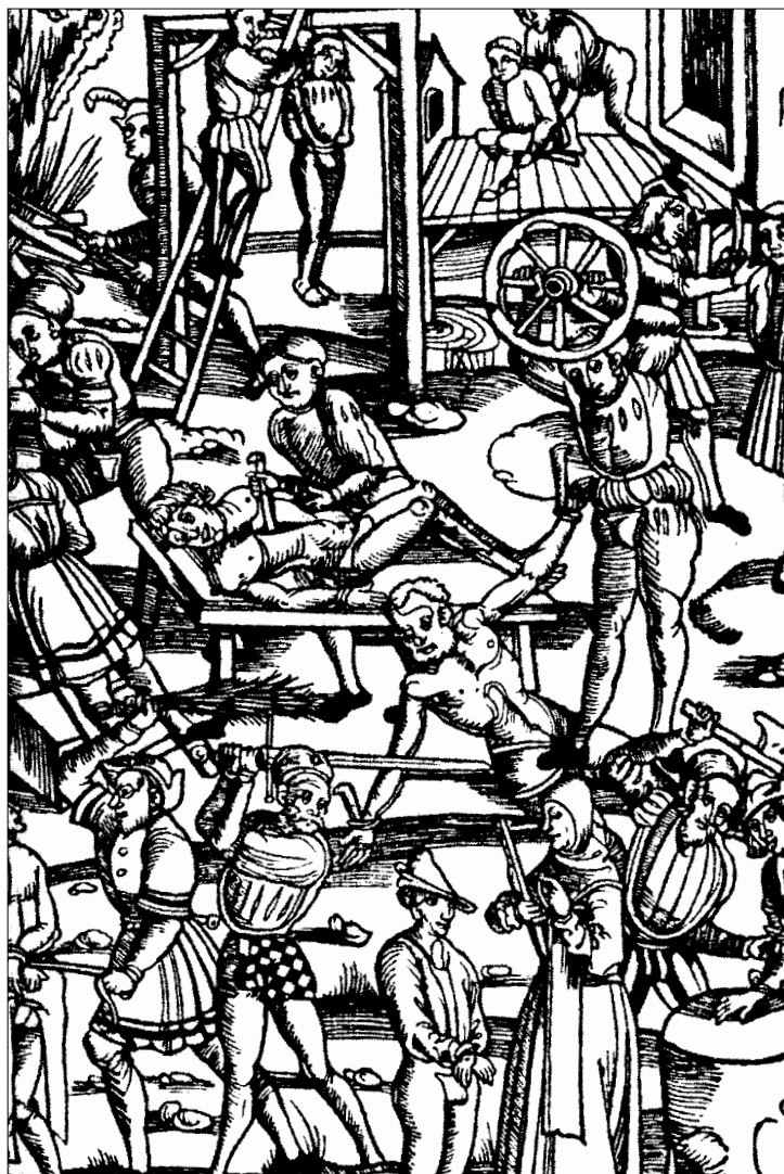
Er bestond een heel scala aan lijfstraffen in vroeger eeuwen.

leidde vaak tot banbreuk, banbreuk leidde tot strengere straffen en omdat recidive meegeenomen werd in de strafmaat leverde dit nog strengere straffen op. De meest toegepaste lijfstraffen waren geseling en brandmerking en uiteindelijk was in veel gevallen de galg het eindpunt van het zwerversbestaan. Ging het in de achttiende eeuw beter?