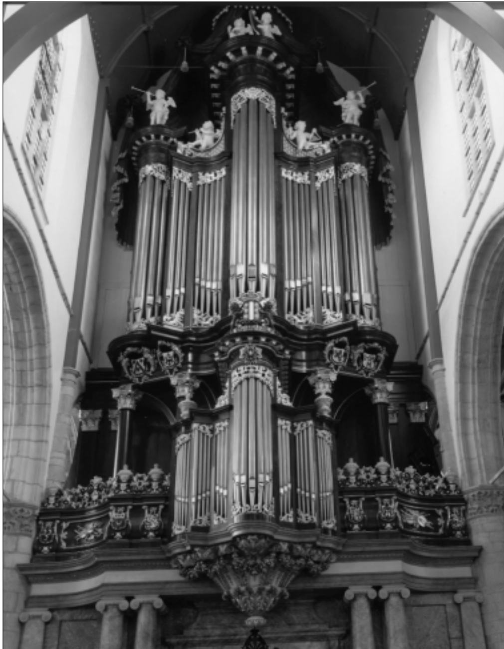
Barokorgel in de Sint-Janskerk, tussen 1732 en 1736 gebouwd door J.F. Moreau.

voering van enkele composities' en 'demonstraties van enige registers'. In oktober is er een lezing over tegels; beide keren is voor de zaterdagmiddag gekozen.