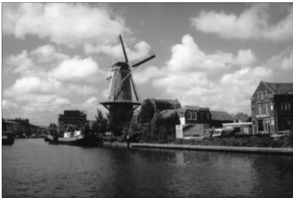
Een herboren 'Roode Leeuw' rond 1990.

Zo kwamen en gingen zij: gebouwen die verzezen en gesloopt werden; generaties molenaars en andere Gouvenaars die voor kortere of langere tijd woonden onder de wieken van deze oude molen; kinderen die er speelden of vochten; volwassenen die de straten bevolkten op weg van en naar hun werk; de bedrijvigheid aan de kaden; schepen die er aanlegden, afmeerden of voorbij voeren. En 'De Roode Leeuw' ... hij heeft alles gezien.