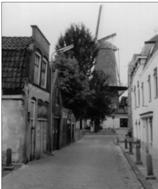
Aan het eind van de 20e eeuw ontstaat bovenstaand beeld: Het Roomse Hofje is verdwenen en de huizen links zijn tot bouwval gereduceerd.