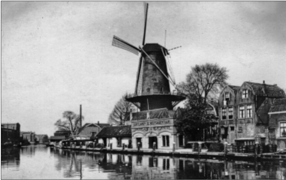
'De Roode Leeuw' gezien vanaf de Turfsingel midden 20e eeuw. Aan de voet van de molen: Dortland's Scheepsagentuur. Links daarvan de Asschuur.