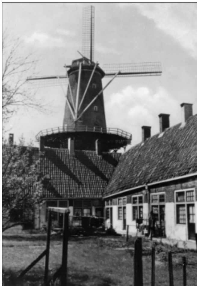
Gezicht op 'De Roode Leeuw' vanaf de binnenplaats van het Roomse Hofje omstreeks 1930.

De huisjes, die met de achterzijde naar de straat stonden, hadden van die kant weinig fraais te bieden. Er bevonden zich aan de straatzijde geen vensters, alleen achterdeuren. Des te schilderachtiger was het Roomse hofje vanaf de binnenplaats gezien, vooral in de richting van de molen. Ook de toegangspoort was voor beeldende kunstenaars een bron van inspiratie. Aan de buitenzijde werd deze poort bij donker verlicht door een grote lantaarn, die tot in de jaren vijftig door middel van een lange stok met haak werd aangestoken door een lantaarnopsteker. Aanvankelijk was er sprake van 15 huisjes, maar vanaf het midden van de zeventiende eeuw moeten dat er 20 zijn geweest. De huisjes werden bewoond door vrouwen die allen van rooms-katholieken huize waren, vandaar de aanduiding Roomse hofje. Van de periode 1684 tot 1713 weten we nauwkeurig wie er in welk huisje woonden. De bron van deze kennis is het administratieboekje dat uit die tijd bewaard is gebleven, het zogenaamde Boeckie van Buytenwegen Erff , in bezit van het archief van de oud-katholieke parochie van Gouda.