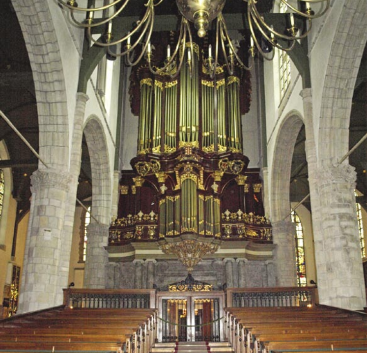
Het Moreau-orgel in de St. Janskerk