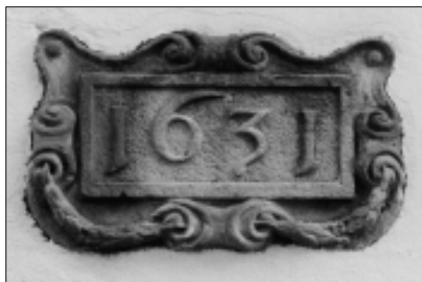
Gevelsteen aan de buitenzijde Grote Volmolen.

De resten van het kasteel speelden tijdens de bouw van de volmolen in 1631 een grote rol. Ten eerste werd de molen bovenop de puinhopen en gewelven gebouwd. Ten tweede moest er een duiker worden gegraven door deze lagen. Ten derde stonden er nog twee torens, de Chartertoren en de Kleine Ijsseltoren, waarvan de eerste in de directe nabijheid van de molen stond. Uit de eerste twee punten kan men concluderen dat een bouwkundig onderzoek naar de fundering van de volmolen geen overbodige luxe is. De kasteelgewelven zijn namelijk niet gebouwd om een zware last te dragen. De aanleg van de duiker zal de stevigheid van de constructie geen goed hebben gedaan. Aangezien het volmolengebouw diverse malen is verbouwd en uitgebreid zijn we een illusie armer.