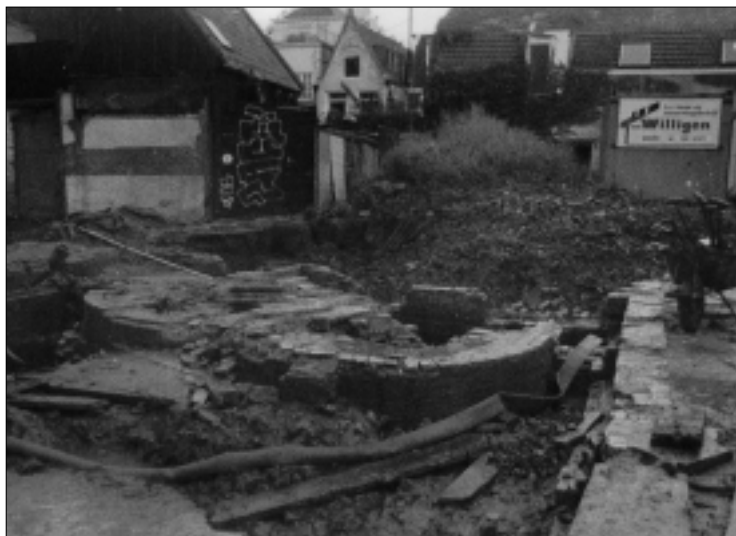
Opgraving aan de Raam, 1999.

voor de lakenververij. In feite waren het slechts de funderingen die nog restten. Desondanks konden de stookplaatsen worden gereconstrueerd. Achter de stookruimte bevonden zich twee stookkanalen.