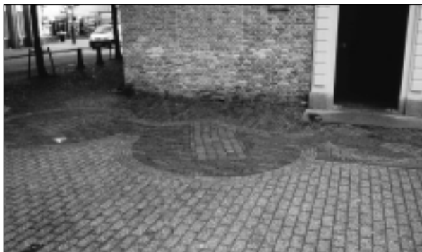
De stookplaatsen, verbeeld in de bestrating.

De lakenwerkers mochten twee jaar kosteloos in de huizen wonen. Daarna betaalden zij een huurprijs die was gerelateerd aan de kosten van het opknappen van de huisjes. De buurt was bekend onder de naam Klein Vlaanderen, zoals het staat vermeld op een stadsplattegrond van Claesz. Jansz. Visscher uit 1612. In 1605 kwamen de huizen in handen van de Gasthuismeesters die de kloostergebouwen vanaf 1574 tot 1586 reeds in hun bezit hadden gehad.