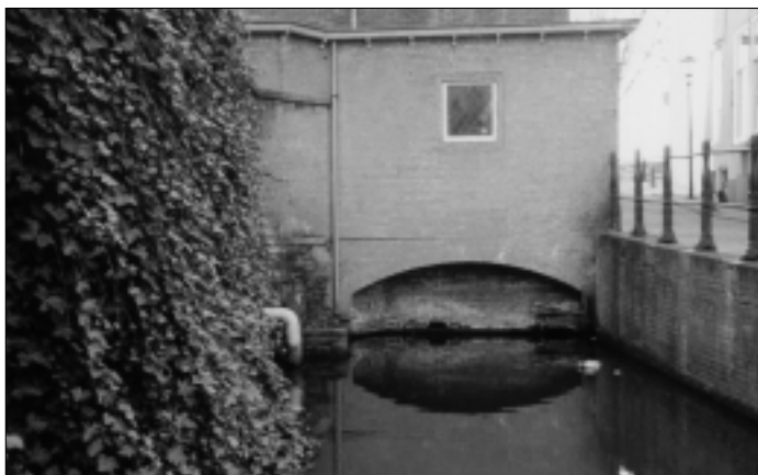
Duiker aan de Peperstraat. Foto: auteur.

Aanbesteding voor de volmolen aan de Punt, 1620. Bron: J.E.J. Geselschap, De lakennijverheid (1972) 139.