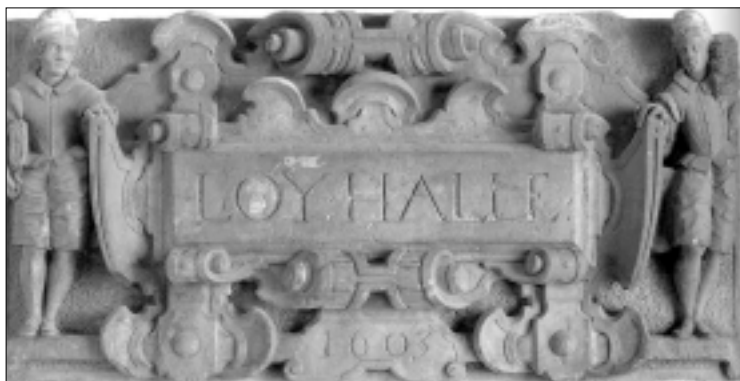
Gevelsteen van Gregorius Cool. Bron: Tom Haartsen, De gilden in Gouda , 96.

De lakenhal wachtte eenzelfde noodlot. Na enkele malen van bestemming te zijn gewisseld, verviel het complex. Het gevaar van gedeeltelijke instorting was niet denkbeeldig. Ondanks de historische waarde achtte de gemeente restauratie te duur. Het gehele kloostercomplex werd in 1942 afgebroken. Het Raoul Wallenbergplantsoen, tussen de Jeruzalemstraat en de Groeneweg, markeert de plaats waar de Pauluskapel stond. Tastbare overblijfselen van de hal moeten we elders in Gouda zoeken. Stenen werden gebruikt voor restauratie van de Gasthuiskapel en de Agnietenkapel. Fragmenten met architectonische en/of historische waarde gingen naar het stedelijk museum. 28 Achter Stedelijk Museum het Catharina Gasthuis aan Achter de Kerk is een grote verzameling gevelstenen bijeengebracht van gebouwen die gesloopt zijn. Hier staat in de tuin als toegangspoort het Lazaruspoortje. 29 Binnenin het poortje bevindt zich aan de rechterkant de gevelsteen van de lakenhal. Op de steen staan twee lakenbewerkers, een oude (links) en een jonge man. De oude man draagt een pak laken onder zijn arm. Zijn jonge collega draagt een pak over zijn schouder. Zij flankeren de in een fraai gekrulde omlijsting (cartouche) gehulde naamplaat met de inscriptie 'Loyhalle'. De verklaring voor de naam zit in het lood dat als keurmerk