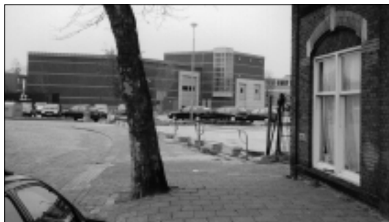
De geschiedenis is ver te zoeken...

Het is spijtig dat het archeologisch onderzoek dat in 1995 tijdens bodemsanering op het Bolwerk plaatsvond, zich niet uitstreckte tot dit gebied. Hoewel het onderzoek grotendeels beperkt bleef tot het begeleiden van en meekijken bij het afgraven van verontreinigde grond leverde het 'een gedetailleerder beeld op (...) van het werken en wonen aan de Lazarussteeg, dan vooraf werd verwacht.' 46 Helaas betreft het hier geen sporen van de lakennijverheid. Hoe anders zou dat zijn bij opgravingen aan het Nonnenwater. De lakenbedrijvigheid aldaar in aanmerking genomen zou een opgraving zeker vruchten afwerpen. En welke interessante gegevens boven de grond kunnen komen, bewees het onderzoek aan de Raam, op luttele meters afstand van het Sint-Marielklooster, in 1999.