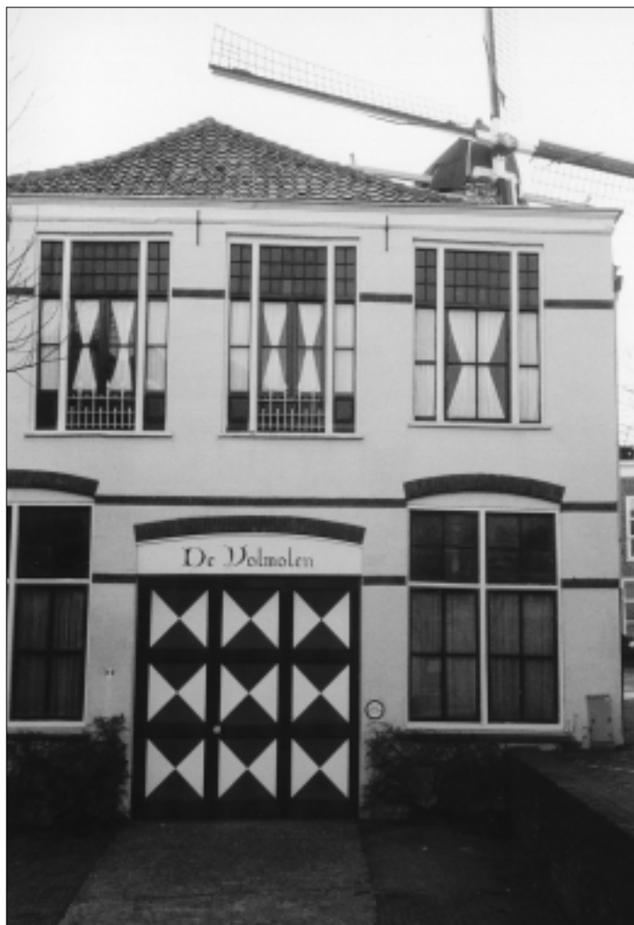
De Grote Volmolen, begin 21e eeuw.

innert hieraan. Boven de bedrijfsruimte bevond zich een turfzolder. In de bedrijfsruimte stonden aanvankelijk acht volkommen. Voor de technische installatie was de Amsterdammer Cornelis Gerritszoon Mastemaker verantwoordelijk. In 1632 werd het aantal volkommen uitgebreid tot twaalf stuks. Het huidige vloerniveau ligt hoger dan het oorspronkelijke. Dit is niet de enige bouwtechnische aanpassing geweest sinds 1631.