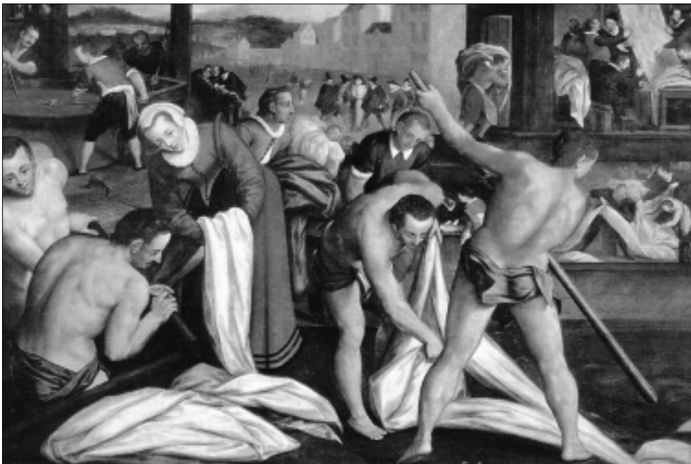
Het vollen. Schilderij van Isaac van Swanenburch (1538-1614).