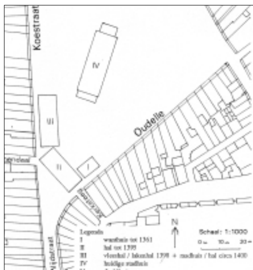
Markt met publieke gebouwen. (Ibelings, Markt en publieke gebouwen, 56).

Hoelang de gebouwen op het marktveld hebben gestaan, is onbekend. Waarschijnlijk is dat er in de tweede helft van de vijftiende eeuw nog delen restten. 16 Mogelijk trof de stadsbrand van 1437 ook het 'economisch centrum' van de stad. De gebouwen, waaronder het wanthuis, waren immers deels uit leem opgetrokken. 17 Herstelwerkzaamheden van leem- en vlechtwerk aan het raadhuis doen vermoeden dat de gebouwen op de Markt in ieder geval nog een tijdje dienst moesten doen. Het raadhuis moest in ieder geval nog bruikbaar blijven totdat het nieuwe stadhuis, centraal op de Markt, gereed