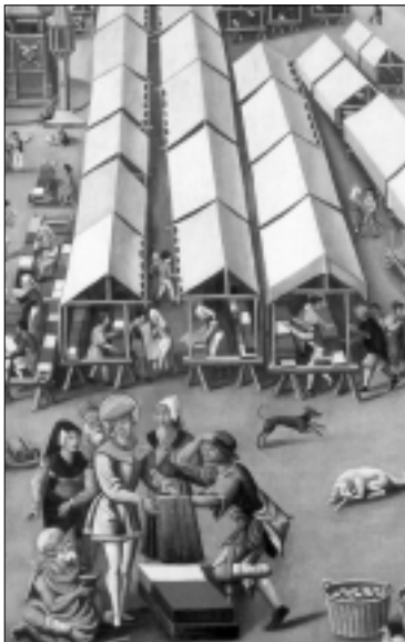
Lakenmarkt te Hertogenbosch met op de voorgrond Sint-Franciscus. Schilderij ca. 1525.

mitter hant, om gunst off om loon, die verbuerde twee jair die stede.' 5 Ten tweede, in het schema zijn niet de keuringen aangegeven die nagenoeg na iedere bewerking volgden.