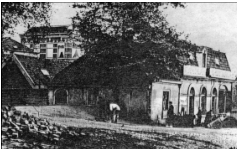
De Kleine Volmolen, enkele decennia voor de sloop. Ansichtkaart, ca. 1910.

verplicht om een administratie bij te houden van al het volwerk. Tevens moest hij toezicht gedogen. Controleurs mochten ieder moment binnenvallen om het laken te keuren en van een lood te voorzien. In de overige ruimten in het pand werd in 1625 een moutmolen gebouwd. Het zou slechts enkele decennia duren voordat het gehele molencomplex een andere bestemming kreeg. In 1656 zag de toekomst van de volmolen er nog rooskleurig