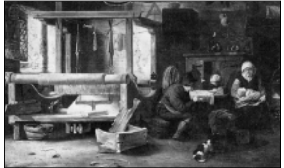
Weversinterieur. Schilderij van Adriaen van Ostade.

De lakennijverheid is van oudsher een huisnijverheid. Tot de Industriële Revolutie in de achttiende, negentiende eeuw was de textielsector ondergebracht in kleine werkplaatsen waar de ambachtsman ook huisde. Om een beeld te vormen van zo'n 'werkhuis', geven schilderijen zoals dat van Adriaen van Ostade (1610-1685) een indicatie. Eveneens illustrerend zijn de gereconstrueerde wevershuizen zoals die te zien zijn in het archeologische themapark Archeon in Alphen aan de Rijn. Daar wordt duidelijk dat de ambachtsman ook winkelier was. Voor de werkplaats bevindt zich aan de straatkant de uitklapbare 'etalage' waar de koopwaar aangeprezen werd. De ruimte die het weefgetouw inneemt ten aanzien van de geringe leefruimte zou volgens de huidige werknemersorganisaties vast niet door de beugel kunnen.