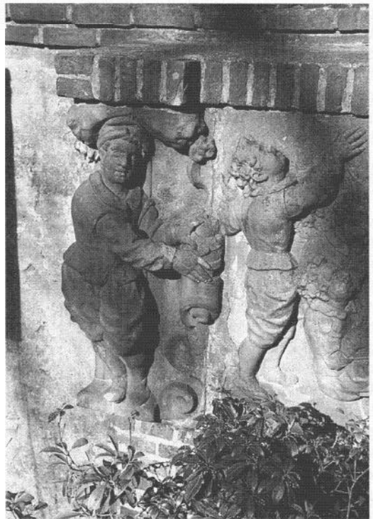
4. Gedeelte van een gevelsteen in de tuin van het museum het Catharina Gasthuis.