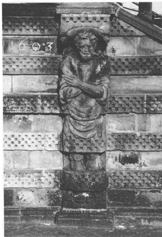
2) Pilasterfiguur aan het bordes van het stadhuis te Gouda.

In een van de plaatwerken van Hans Vredeman de Vries staat een serie ontwerpen van kariatiden en daarbij zijn ook pilasterfiguren die kussens met kwasten op het hoofd hebben. 10 Ambachtslieden door heel Europa werkten, zoals hiervoor al werd opgemerkt, naar voorbeeld van ornamentprenten en voorbeeldboeken. Het is dan ook niet vreemd dat in Breslau, het tegenwoordige Wroclaw; in de Elisabethskerk een epitaaf werd gemaakt met pilasterfiguren die kussens met kwasten op het hoofd hebben. 11 Het epitaaf voor David Schilling (afbeelding 1) dateert van na 1559 en mevrouw E. Neurdenburg sluit niet uit dat Gregorius Cool dit kunstwerk heeft gekend, voor hij, naar Gouda kwam. In mei 1602 kreeg hij van de burgemeesters de opdracht voor het stadhuisbordes, dat in 1603 werd opgeleverd. Aan de voorkant van het bordes staan twee pilasterfiguren met kussens met kwasten op het hoofd (afbeelding 2). Cool kan het motief van de kussens met kwasten voor zijn pilasterfiguren, behalve aan het genoemde kunstwerk, natuurlijk ook rechtstreeks aan Vredeman de Vries hebben ontleend.