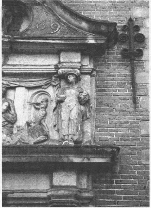
3. Draagfiguur aan het Lazaruspoortje te Gouda.

Vreemd is ook dat, zonder bronvermelding, in dezelfde context wordt beweerd dat het Goudse stadhuisbordes een geschenk aan de stad zou zijn geweest van het gilde der zakkendragers. 22 Iets minder stellig drukt de auteur zich uit, die veronderstelt dat in het algemeen wordt aangenomen dat het bordes een geschenk van het zakkendragersgilde zou zijn geweest, wat hij daarna aannemelijk probeert te maken