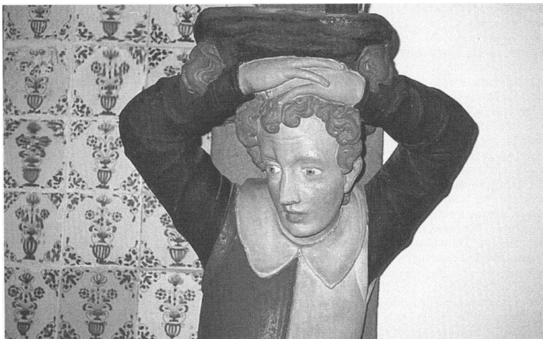
5. Draagfiguur van de schouw in het museum Be Moriaan.

door erop te wijzen dat de zakkendragers zich waarschijnlijk moeiteloos met deze pilasterfiguren geïdentificeerd zullen kunnen hebben. 23 Dit is een voorbeeld van 'hineininterpretieren' en ik houd het erop - totdat het tegendeel aan de hand van bronnenmateriaal wordt bewezen - dat het zakkendragersgilde rechtstreeks geen enkele penning aan de kosten van het bordes heeft bijgedragen. 24