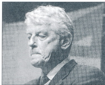
Wim Kok die net zijn terugtreden heeft aangekondigd (bron: de Volkskrant, 29 augustus 2001).

Ad Melkert heeft een scherpe herinnering behouden aan de eerste dagen op school: 'Mij staat nog bij dat van het begin af de net aangekomen leerlingen op het Coornhert Gymnasium werd duidelijk gemaakt dat zij uitverkoren waren om voorbereid te worden op het in de schoot