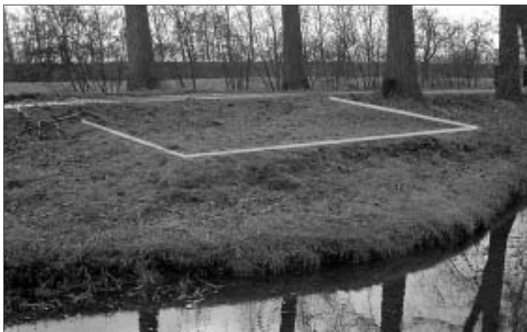
Fundering B vanuit het noordoosten gezien. De natuurstenen fundering is goed zichtbaar in het veld. De witte lijn geeft aan waar het muurwerk loopt.

1 bevindt zich direct voor de tuin van de boerderij, op het perceel dat ook wel als de boomgaard wordt aangeduid. Locatie 2 betreft het perceel, waarop ook muur A werd waargenomen.