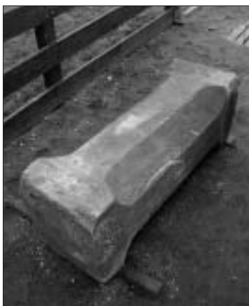
Links een fragment glas, dat ooit in een glas in lood raam gevat zal hebben gezeten. Rechts de natuurstenen zuil, zoals die op het kloosterterrein werd aangetroffen.

Het aangetroffen bouw materiaal kan ons iets vertellen over het uiterlijk van het klooster. Op het terrein werden twee soorten bakstenen aangetroffen, ijsselstenen en kloostermoppen. De kloostermop is een grote, grove baksteen, roodbruin van kleur, terwijl de veelal gele ijsselsteen aanzienlijk kleiner en fijner is. Voorts werden aanzienlijke hoeveelheden kalk- en zandsteen aangetroffen, waarvan het oorspronkelijke gebruik niet bekend is. Mogelijk was deze steensoort als 'speklaag' in de muren verwerkt of werden zelfs volledige muren met dit materiaal geconstrueerd of bekleed. De aan-