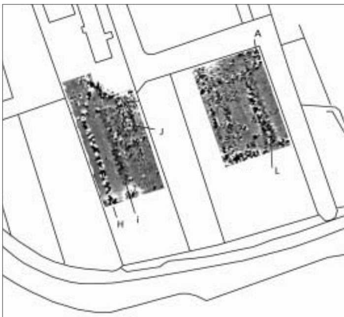
Magnetometerresultaten van de twee onderzochte deelgebieden. Links locatie 1, rechts locatie 2. De letters geven enkele opvallende uitslagen aan.

Het interpreteren van de metingen blijkt veelal problematisch. Zo ook in dit geval. Helaas zijn vooral de kabels en leidingen duidelijk te onderscheiden. Het is zeker, en mogelijk ook I, kunnen als zodanig worden geïnterpreteerd. Voor de overige uitslagen ligt het moeilijker. Op de meest interessante locatie J zijn waarschijnlijk concrete resten van het klooster in de bodem aanwezig, hoewel een duidelijke structuur moeilijk kan worden gereconstrueerd. De globaal noord-zuid verlopende lijn L kan waarschijnlijk als oude,