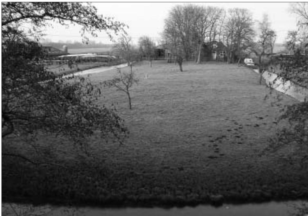
Overzicht van het kloosterterrein, zoals dat er nu bij ligt. Tussen het geboomte ligt boerderij 't Klooster.

In dit artikel wordt aandacht besteed aan de fysieke resten van het klooster, zoals dat zich ooit uitstreckte langs de Steinse dijk. De benadering is in hoofdzaak archeologisch. Zowel bestaande - maar ongepubliceerde - waarnemingen als recent uitgevoerd bodemonderzoek kunnen ons helpen een beeld te vormen van het oorspronkelijke klooster. Om verschillende redenen zijn de beschikbare gegevens echter fragmentarisch, waardoor het lastig zal blijken een samenhangende reconstructie te creëren. Het veldonderzoek werd uitgevoerd in samenwerking met Archeologische Vereniging Golda en David Wilbourn. 2