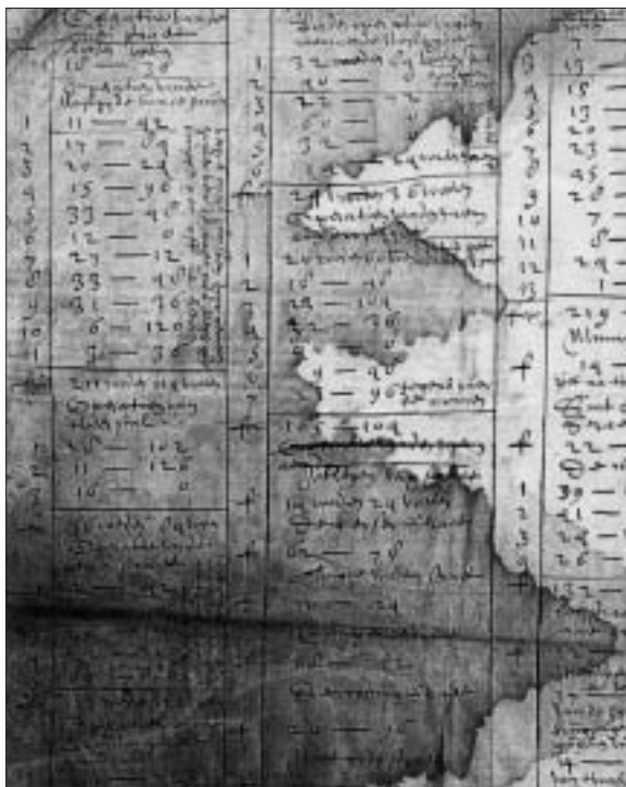
Fragment van de straatopmeting uit 1611.

De straatmeting is in het Archief van de Fabricagemeesters opgenomen en in principe eenvoudig te vinden. 9 Er iets mee doen is een andere zaak. Het procesverbaal is een korte toelichting van de opdracht, aangevuld met een lijst met straten en bijbehorende getallen in roeden en voeten. Bijgevoegd zat echter een door vocht aangeast vel papier van circa 60 bij 40 cm, in vieren gevouwen en beschreven in 8 kolommen. Iedere kolom is onderverdeeld in een hoofdkolom met de naam van de straat en eronder 1 tot 11 rijen getallen, die uiteindelijk in stappen gesommeerd worden. Bij iedere kolom is een kleine hulpkolom met de nummering van de rijen getallen; soms is nog een korte toelichting toegevoegd. Om een indruk te geven, is een deel van dit document met de straten in het zuidwestelijk deel van de binnenstad afgebeeld.