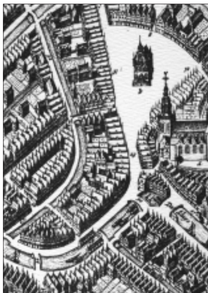
Markt en omgeving; Blaeu 1649.

Ook hier komt de straatmeting uit 1617 vrijwel overeen met het kadaster, maar het aantal op de kaarten getekende percelen is weer veel kleiner. Vergelijking van de kaarten van Braun & Hogenberg met de wat latere kaarten van Visscher en Blaeu geeft aan dat de arkeltorentjes verdwenen zijn. Wat ook opvalt is dat de huizen op iedere kaart erg repeterend zijn weergegeven maar dat de vorm van daken en gevels wel verandert per kaart. Dit zou kunnen wijzen op snelle ontwikkelingen maar we geloven niet dat er rond 1600 in een periode van 70 jaar driemaal nieuwbouw plaatsvond.