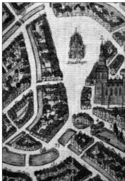
Markt en omgeving; Braun & Hogenberg 1585.

Het aardige van de straatmeting van 1617 is dat daarmee nauwkeurig kan worden aangegeven waar de oude Waag en de andere gesloopte panden hebben gestaan. Ook van alle andere panden, die toen langs de Noordzijde van de Markt stonden, werd de gevelbreedte gemeten. Er wordt in de straatmetingen uiteraard geen luifel beschreven maar over die aanwezigheid kan ons inziens ook geen zekerheid bestaan. Om een indruk te geven van de weergave van panden op de vogelvluchtkaarten, hebben we een fragment van 11 bij 11 cm van de kaart van Braun & Hogenberg als afbeelding opgenomen. Vervolgens hebben we het aantal panden langs de Noordzijde Markt op de reeds eerder genoemde vogelvluchtkaarten geteld en vergeleken met de opmetingen.