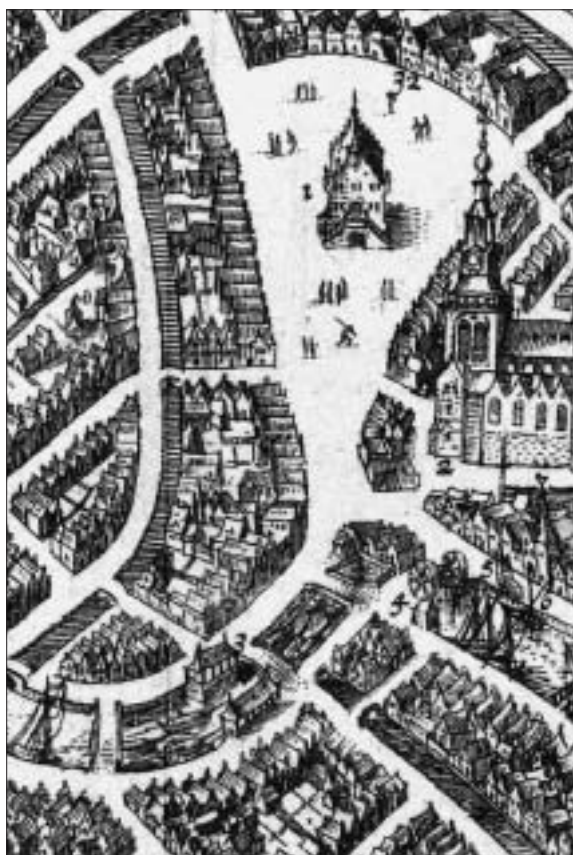
Markt en omgeving; Visscher 1612.