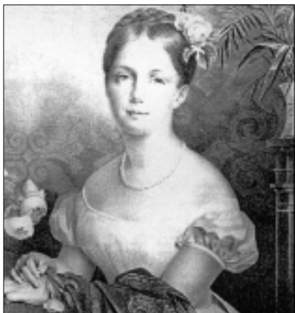
Prinses Marianne, uitgebeeld zoals zij was ten tijde van haar bezoek aan de kerk in 1826. Litho naar F. Krüger.