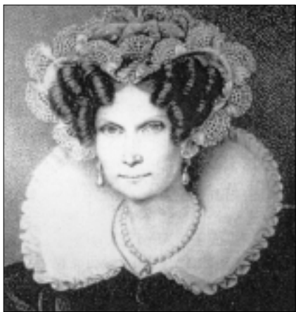
Wilhelmina van Pruisen, echtgenote van koning Willem I en moeder van prinses Marianne. Schilderij door J.B. van der Hulst.