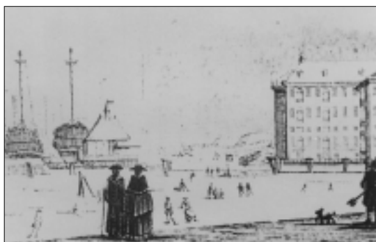
Afb. 1: Winter 1767/68: een bevroren IJ nabij de Admiraliteitswerf en het magazijn.

Met behulp van deze zeejournalen is het ook mogelijk om een beeld te schetsen van het vlootbezoek en een indruk te geven van de belevenissen van zowel de Prins als van Vlacq en andere opvarenden van zijn schepen. Ter afwisseling zijn nog enkele indrukken van andere waarnemers toegevoegd, met als aardigste bron de notities van een hofdame uit het gevolg van de Prinses. In 1980 heeft J. Fox die notities bewerkt en van een toelichting voorzien. 4 Voor het aansluitende bezoek van de Prins en Prinses aan Amsterdam is het in 1768 verschenen boek van de Amsterdamse geschiedschrijver Jan Wagenaar met de bijbehorende gravures de belangrijkste bron van informatie. 5