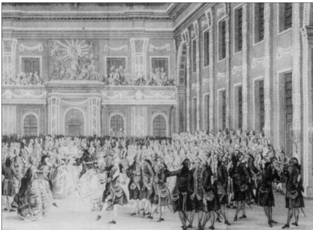
Afb. 6: Bal in de Grote Zaal van het stadhuis op de Dam.

genodigd.' Nummer 6 blijkt vice-admiraal Vlacq te zijn. Ook van deze maaltijd heeft Simon Fokke een gravure gemaakt, deze is gedeeltelijk in afbeelding 5 overgenomen. 'Geduurende de maaltijd was er verrukkelyk Musyk van speeltuigen en onder de hooge Gasten heerschte een algemeen genoegen'. Aansluitend gaat men naar de Schouwburg, waar het treurspel Démophonte en de klucht 'den Huwelyken staat' worden opgevoerd. We volstaan met het aanhalen van freule Dankelman: 'Pendant le spectacle on servit tous les rafraichemens imaginables avec des glaces et des confitures, non seulement dans la loge de Leurs Altesses mais aussi au parterre et toute les autres loges'. Om 11 uur gaat men weer terug naar het stadhuis.