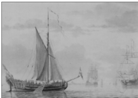
Afb. 3: Admiraliteitsjacht voor stille drijvend.