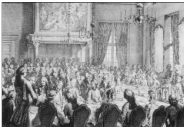
Afb. 5: Maaltijd in de Schepenkamer van het stadhuis op de Dam.

Op woensdag 1 juni wordt de Prins ook als bewindhebber van resp. de Verenigde Oostindische en de Westindische Compagnie geïnstalleerd. 's-Middags volgt in de grote zaal van het stadhuis een ontvangst 'voor alle Heeren van de Regeeringe en derselver Vrouwen, en aan andere voornaame Burgers en Ingezeetenen, en Vreemdelingen zelve. Midderwijl was er in Schepens-Kamer, eene groote maaltijd toebereid, voor ruim 70 personen. Hunne Hoogheden en derselver gevolg, maakten zeventien personen uit. Hierby kwamen de Hertog en tien gasten door den Prinse