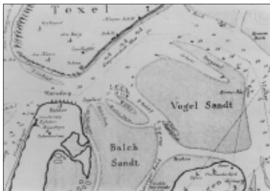
Afb. 2: Onderdeel 18e-eeuwse kaart met de wateren nabij Texel en Den Helder.

Gespreid over maart 1768 vertrekken de schepen uit Amsterdam, ‘de Blois was al 1 maart gezeild en met de kameele over Pampus gebracht’. Voor de andere schepen wordt het echter een tocht van twee maanden naar de rede van Texel. Men ligt bijna een maand voor Durgerdam aan de noordzijde van de IJmond. Pas op 20 april wordt Urk bereikt en dan duurt het nog een maand voordat de schepen via de ‘Vlieter’ vaargeul het Noordelijk deel van de Zuiderzee bereiken. Op woensdag 18 mei worden de Amsterdamse loodsen vervangen door de Texelse en in de namiddag gaan de schepen ‘voor ’t Nieuddiep’ op de rede van Texel voor anker. In afbeelding 2 is een deel van een 18e-eeuwse kaart van Nicolaas Witsen overgenomen met aanduiding van het toen zeer smalle ‘vaste land bij Helder’, de ‘koopvaarders Rhee’ ten Zuidoosten van van Texel en de ‘Vlieter’ langs de vele zandbanken. De volgende dag komt Roemer Vlacq aan boord en wordt de S.b.N.-vlag