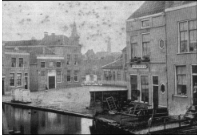
De Hooikade en de Bogen in 1881 met links aan het water vier drinkwatertonnen.