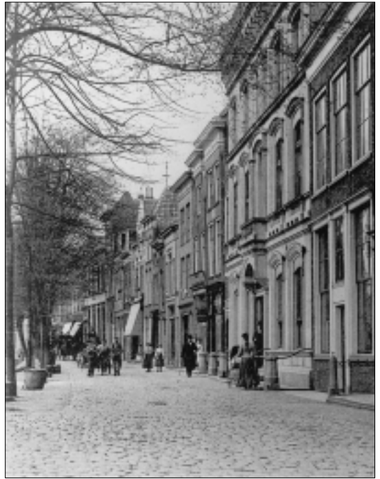
Oosthaven 31, in de woning van Viruly is in de tijd dat deze foto werd gemaakt (1904) sinds enkele jaren het Israëlitisch Oude Mannen- en Vrouwenhuis gevestigd.