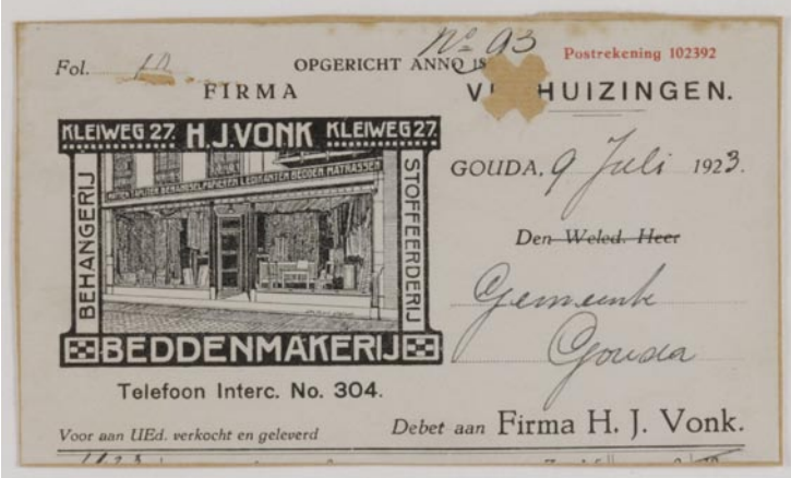
Briefhoofd van de firma H.J. Vonk, 1923. Fotocollectie, inv.nr 54033

naastgelegen drukkerij is rond 1890 al verkocht en een tiental jaren in gebruik bij een andere belangrijke Goudse drukkerij, de firma Koch en Knuttel.