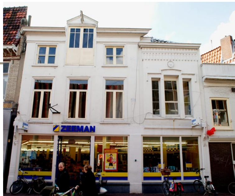
Het tegenwoordige pand van de firma Zeeman. De drukkerij van Van Goor was gevestigd in het aangrenzende pand aan de linkerkant

De eerste bouwtekeningen laten zien dat de firma H&M gelukkig de voorgevel intact zal laten, maar oplettendheid is vereist. Een dergelijke herinnering aan Gouda's roemruchte verleden als boekdrukkersstad mag niet