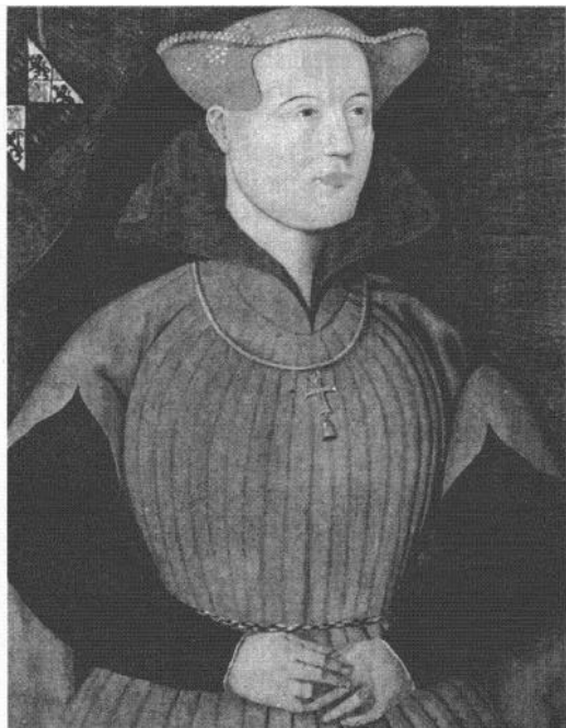
2. Jacoha van Beieren. Paneel uit de 15de eeuw door een anoniem meester.

De ruime opzet van de gebouwen, maakten het klooster uitermate geschikt voor bijeenkomsten van allerlei aard. Albrecht van Saksen, stadhouder van keizer Maximiliaan hield er dagvaart (vergadering van afgevaardigden) en het gerecht van Gouda kwam er regelmatig bijeen.