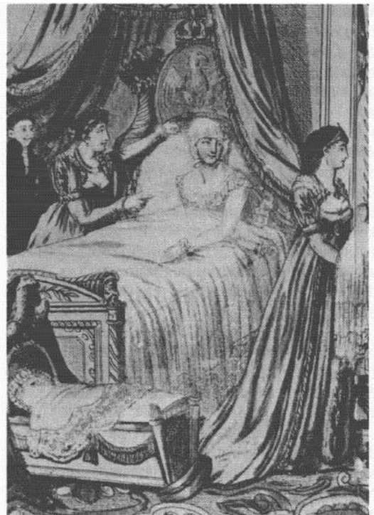
• Liggend in het kraambed kijkt Marie-Louise toe hoe de lang gewenste troonopvolger aan Napoleon (hier niet zichtbaar) wordt getoond (1811). Collectie Musée Carnavalet, Parijs.

Reeds op 26 juli 1811 had de maire van Gouda een brief van de onderprefect ontvangen met het bericht dat het keizerlijk paar naar het Departement van de Monden van de Maas zou komen. Welke gemeenten zij daar zouden bezoeken was nog niet bekend. Hij adviseerde de