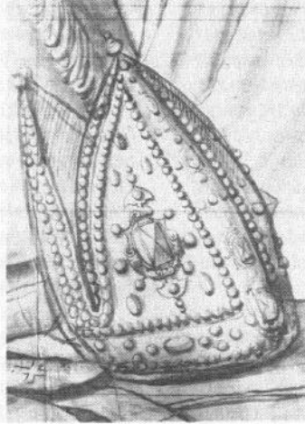
• Afb. 3. De mijter van de abt, zoals afgebeeld in het carton, is in het Glas met veel vakmanschap uitgevoerd, vermoedelijk door of met assistentie van een der gebroeders Crabeth.