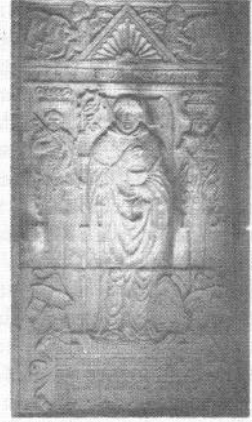
• Afb. 5. Op de grafzerk van Peter van Zuyren zijn dezelfde wapenschilden te zien als in het gebrandschilderde Glas, evenals de lijfspreuk van de abt: virtus per aerumnas = deugd door zware arbeid .

Volgens Ten Bruggencate is de herkomst van de wapens onduidelijk. Het wapen met het ingehoekte schildhoofd, dat zowel op de zerk als in het Glas in de linkerbovenhoek is geplaatst, zou mogelijk het familiewapen van Van Zuyren kunnen zijn.