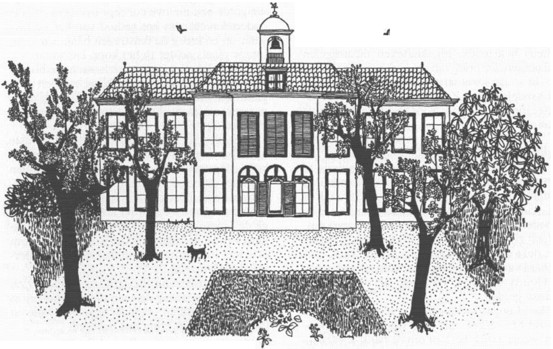
■ Afb| 4 Het buitenverblijf 'Oud- Wassenaar' omstreeks 1800.