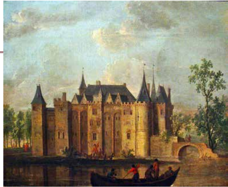
Het voor de graven van Blois gebouwde kasteel van Gouda heeft met zijn personele bezetting en strategische betekenis aan de militarisering van het Goudse openbare leven zeker bijgedragen (Christoffel Pierson)

Het is een bekende gemeenplaats om de manier waarop onze middeleeuwse voorouders met elkaar omgingen, zowel privé als in de openbare ruimte van de stad, te karakteriseren als dikwijls onbeschaafd en hardhandig. Daarin past ook het cliché dat overheden door strenge en bloedige straffen tegen overtreders daar het hunne aan bijdroegen en het straatbeeld bepaalden. Het zou te ver voeren om hier de oorsprong van dit ongenueerde vooroordeel te ontleden. Zeker is wel dat het meer gebaseerd is op anekdotes en minder op bronnen die de praktijk van het dagelijks leven weerspiegelen, of die inzicht bieden in de werkelijkheid van de strafrechtspleging. Ter verontschuldiging mag