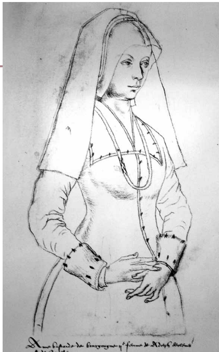
Anna in het zogenaamde Recueil d'Arras , midden 16e eeuw (Arras, Bibliothèque Municipale)

In Duizend jaar Gouda valt te lezen dat de kastelein/kapitein de militaire gouverneur op het slot was. De baljuw had de hoge (lijfstraffelijke) rechtspraak, de schout de lage. Alle drie hadden ze tevens tot taak de belangen van de landsheer te behartigen. Ze werden ook door hem aangesteld en legden geen verantwoording af aan het stadsbestuur maar aan de grafelijke Rekenkamer in Den Haag, wat wel eens tot problemen leidde. Deze functies raakten in Gouda met elkaar verknoopt, ze werden door één persoon uitgeoefend. 1 Daar moet wel bij worden aangetekend dat de verschillende ambten in veel gevallen toch door meerdere plaatsvervaarders werden bezet.