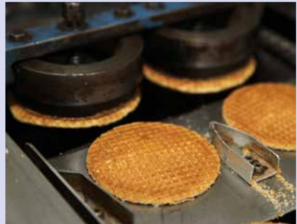
Stroopwafels bakken

Via redactie-tidinge@diegoude.nl komt uw email bij ons terecht. Een van de redacteurs neemt dan contact met u op.