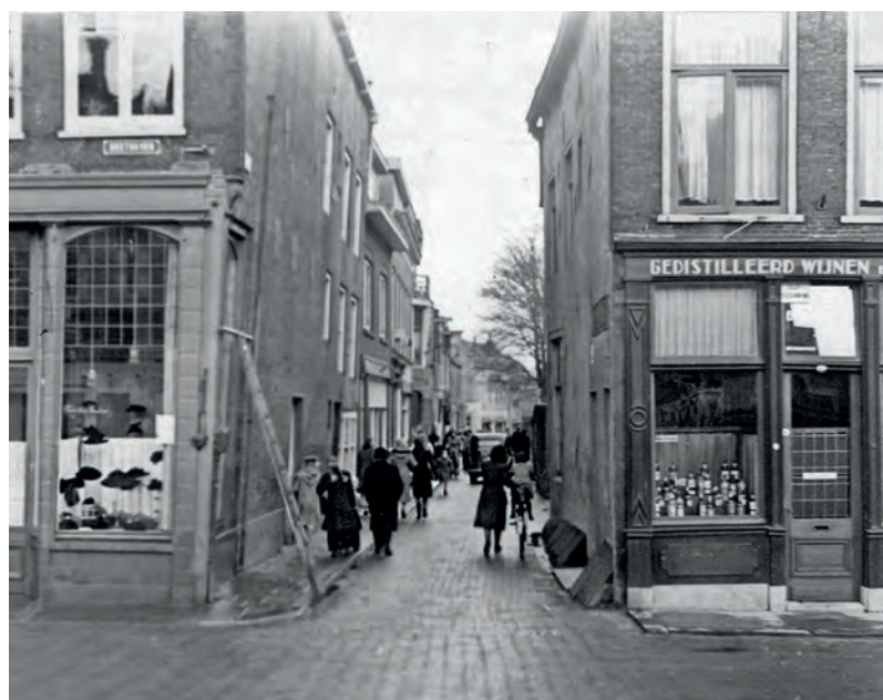
Inkijkje in de Lange Noodgodssteeg rond 1940

de Raam te maken. In 1952 werd met de verbreding van de Lange Noodgodssteeg al een begin gemaakt. De verbrede straat zou een breedte moeten krijgen van 12,5 meter met in het midden een groenstrook van 4,5 meter. In de Kuiperstraat zou de straat zo breed worden dat de Barbaratoren in het midden van de groenstrook zou komen te staan.