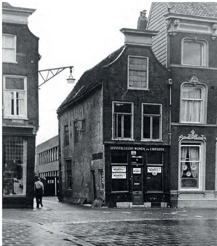
Lange Noodgodssteeg in 1956, met rechts op de hoek Oosthaven 36 vlak voor de sloop.

Op de hoek met de Oosthaven zat rechts wijnhandel Duijnsteeg. In 1956 werd dat pand afgebroken en kon de volle breedte van de straat benut worden. Vanwege de verbreding was er geen sprake meer van een steeg en in september 1955 werd de naam door de gemeente officieel vastgesteld als Lange Noodgodsstraat. (Net als de Aaltje Bakstraat). Om de verbreding verder uit te kunnen voeren werd in