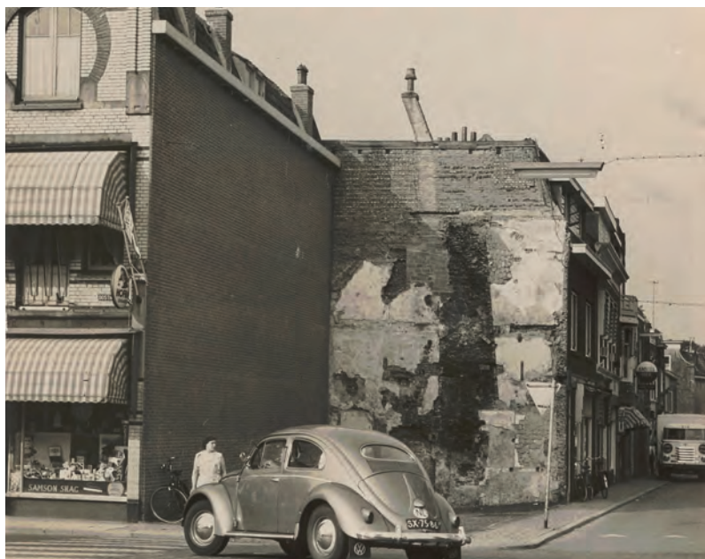
Parkeerplaats ontstaan na de sloop van Oosthaven 35.