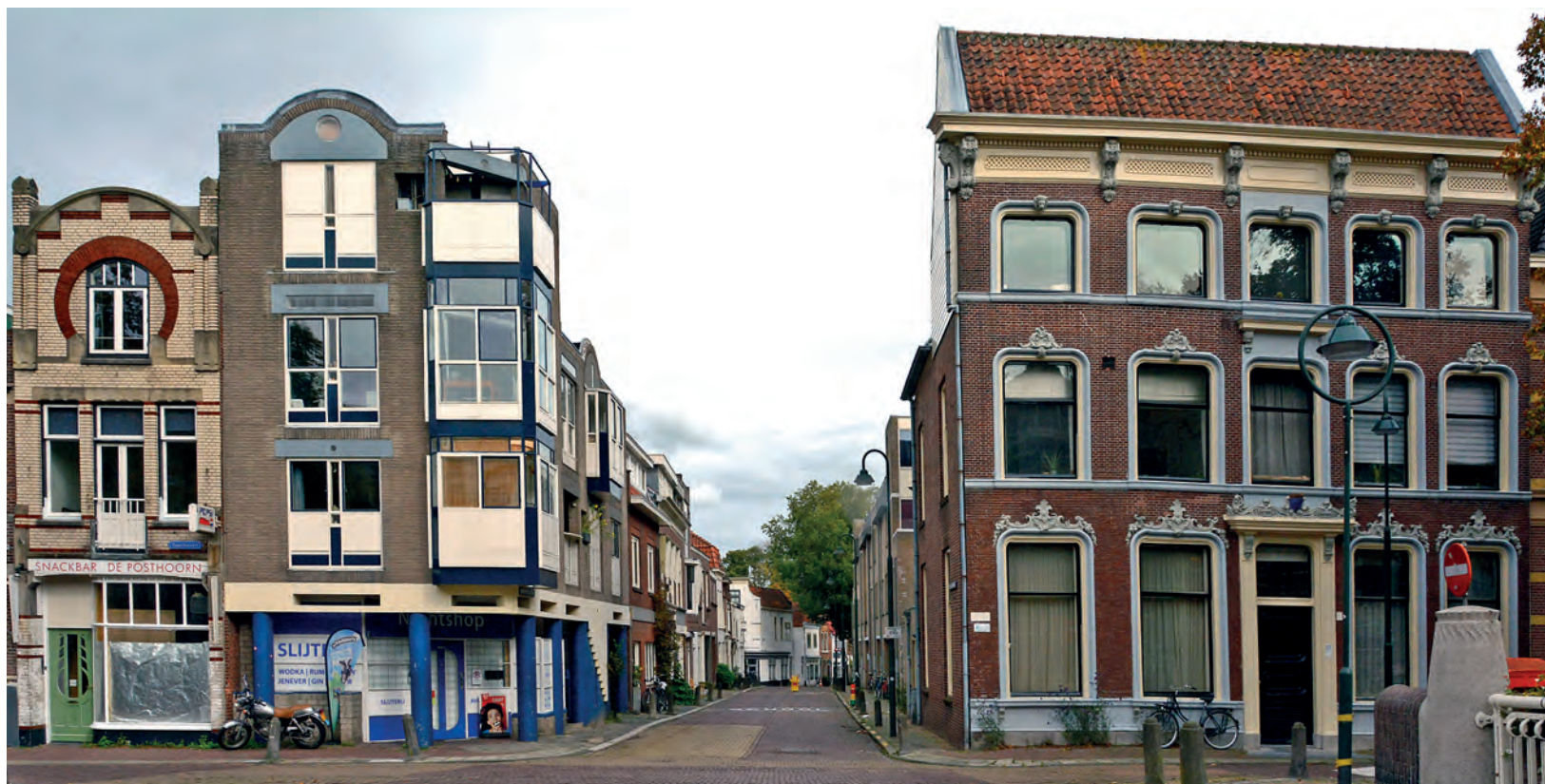
De huidige situatie gezien vanaf de Noodgodsbrug. Vakkundig verknald stadsgezicht