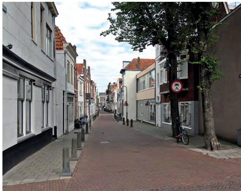
De Walestraat gezien vanaf de Walebrug. Duidelijk zichtbaar is de gedeeltelijke rooilijnverplaatsing